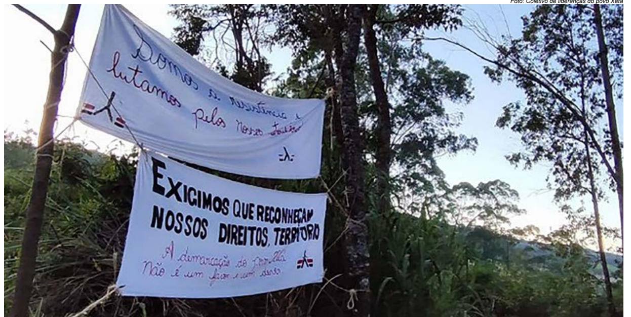
Retomada do povo Xetá

No documento, os Xetá ainda colocam a responsabilidade no estado brasileiro, para que este, evite ainda mais violências e conflitos. Por isso, desde a retomada, as lideranças reivindicam atendimento da Secretaria