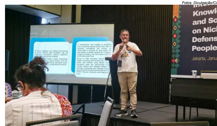
Rodrigues: “Estamos fortalecendo alianças concretas na luta pelo Bem Viver, que só é possível com território protegido e justiça socioambiental”