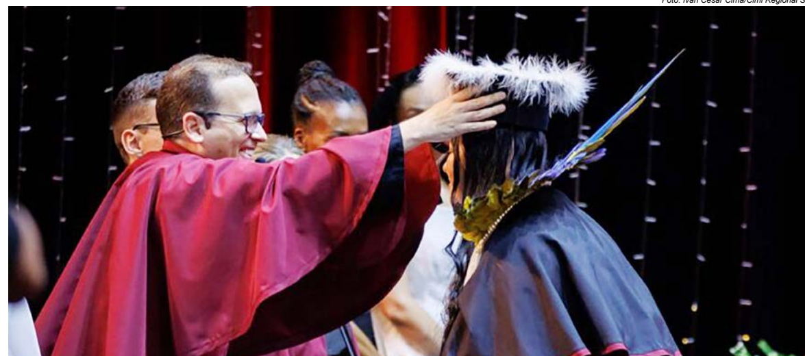
A celebração ocorreu no próprio território reivindicado pelos Kaingang

A formatura de uma mulher Kaingang em Passo Grande do Rio Forquilha revela, com clareza, que quando a terra resiste, o povo floresce — e que cada direito garantido produz frutos que ultrapassam gerações.