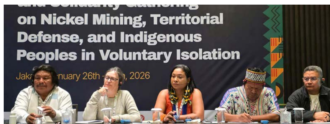
Um dos eixos centrais do encontro foi a crítica ao modelo de transição energética baseado na intensificação da mineração em terras indígenas

Para o Cimi, a participação no evento consolida um eixo de atuação internacionalizado. “Estamos fortalecendo alianças concretas na luta pelo Bem Viver, que só é possível com território protegido e justiça socioambiental”, concluiu Rodrigues.