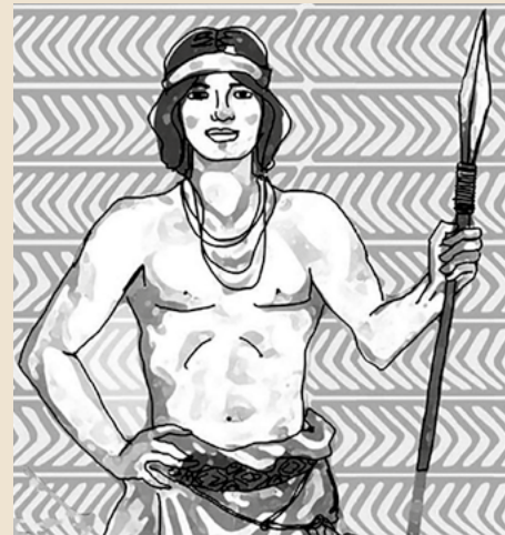
Ilustração publicada na Cartilha da Câmara dos Deputados quando Sepé foi incluído no Panteão dos Heróis da Pátria

Terra negada, rasgada, cercada, consumida como mercadoria e violentada, como os corpos de mulheres e meninas, por homens rudes e criminosos.