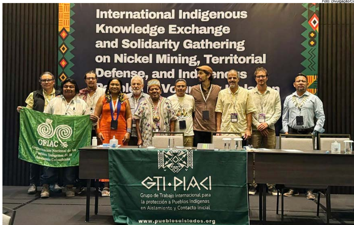
Representantes de povos indígenas de diferentes continentes reuniram-se, entre os dias 26 e 29 de janeiro, na capital da Indonésia, Jacarta

Um dos eixos centrais do encontro foi a crítica ao modelo de transição energética baseado na intensificação da mineração em terras indígenas. Com a demanda global por níquel – usado em baterias de veículos elétricos –, nações como a Indonésia têm aberto novas fronteiras de exploração, muitas vezes