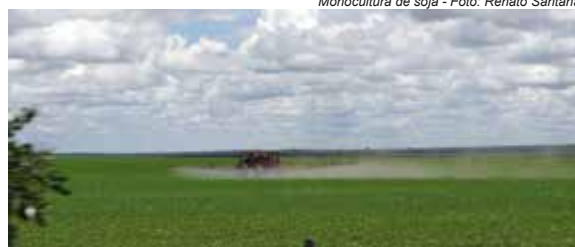
Monocultura de soja

En el actual escenario nada favorable a los derechos indígenas y de otras poblaciones tradicionales fue firmado en mayo de 2015, el Decreto Presidencial n° 8.447, que crea la última frontera agrícola de Brasil, el Matopiba, que es formado por parte de los estados de Maranhão, Tocantins, Piauí y Bahía (las siglas de los cuatro estados forma el nombre de la región). Con una extensión de más de 73 millones de hectáreas, características del bioma de la sabana, conocido en Brasil como bioma “Cerrado”. Esta área está siendo considerada la principal macro región estra-