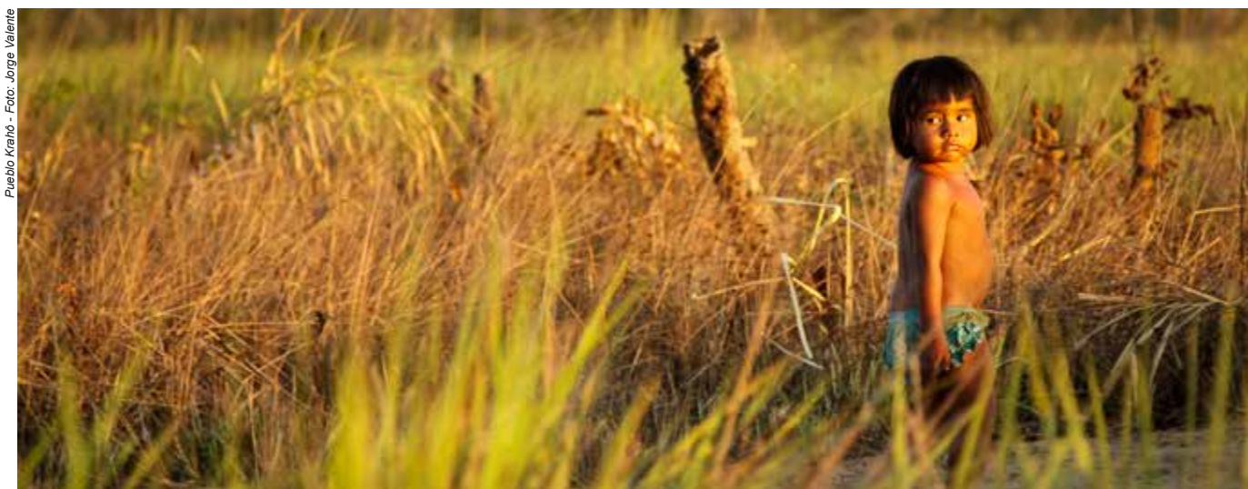
Pueblo Kraho

Diversos documentos y relatorías comprueban que los pueblos indígenas fueron las mayores víctimas de este modelo. Los ejemplos de las construcciones que causaron la muerte de miles de indígenas son enormes: las centrales hidroeléctricas de