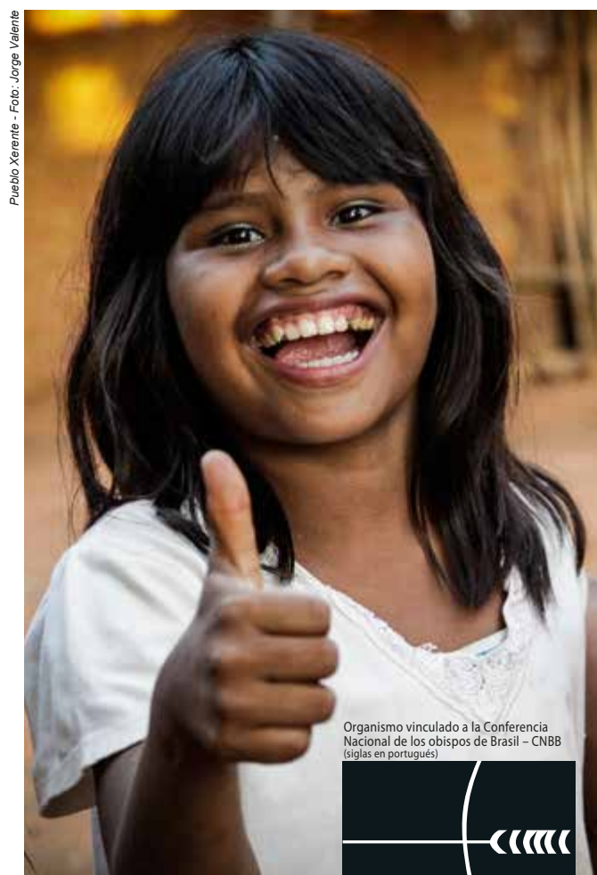
Pueblo Xerente

Movimiento Iperegáyu y Asociación Indígena Pariri Aldea Swré Muybu, Pueblo indígena Munduruku del estado de Pará, 15 de julio de 2015