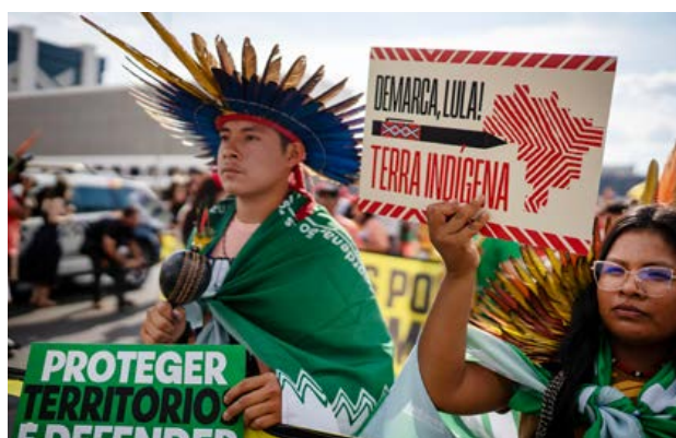
Lideranças indígenas do Pernambuco e da Bahia em Ato intitulado “Demarca, Lula” realizado em 13 de outubro em Brasília