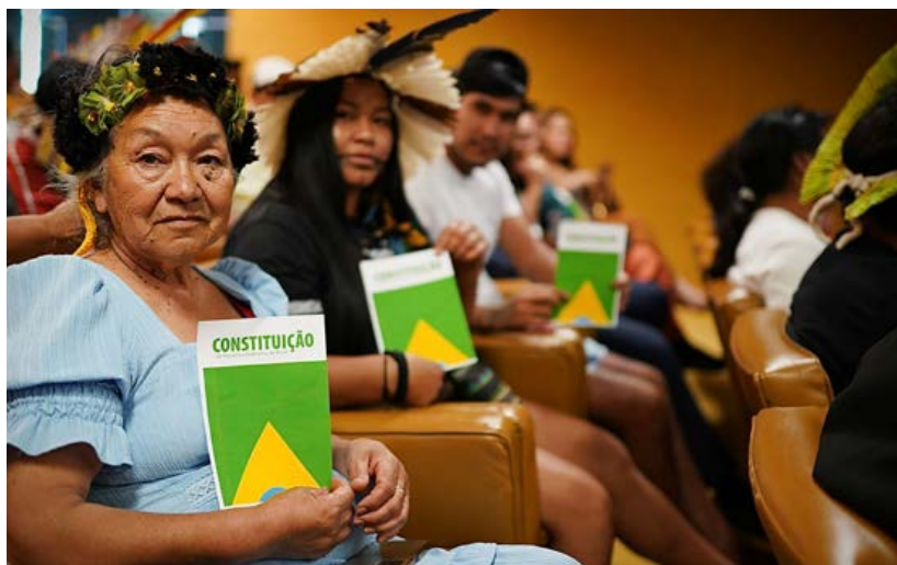
Lideranças indígenas dos povos Kaingang, Xokleng, Guarani e Kaiowá participam de audiência no STF como parte da mobilização em Brasília, reivindicando a demarcação e proteção de suas terras, no marco dos 37 anos da Constituição Federal