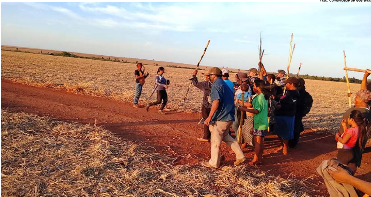
Comunidade Guarani e Kaiowá retoma fazenda sobreposta à TI Guyaroká, no dia 21 de setembro

O apelo é uma atualização sobre a situação de violência e violações de direitos na Terra Indígena Guyaroká presentes na Medida Cautelar (MC 458-19), concedida pela CIDH em 29 de setembro de 2019. A medida tem como objeto a TI Guyaroká e visa garantir os direitos à vida e à integridade pessoal dos indígenas.