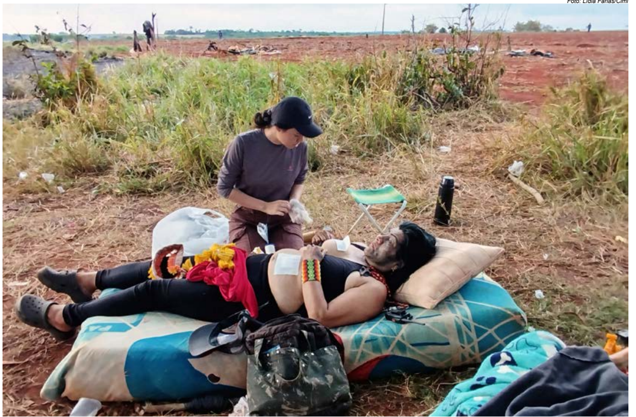
Os feridos foram atendidos na própria retomada logo após os ataques. Na imagem, ao fundo, os barracos destruídos

A retomada da terra não é apenas simbólica. Para os Guarani e Kaiowá, ela representa uma medida de proteção e sobrevivência frente a um padrão de violência que combina despejos, ameaças e ataques químicos, reiterando a urgência de providências legais e de fiscalização por parte do Estado.