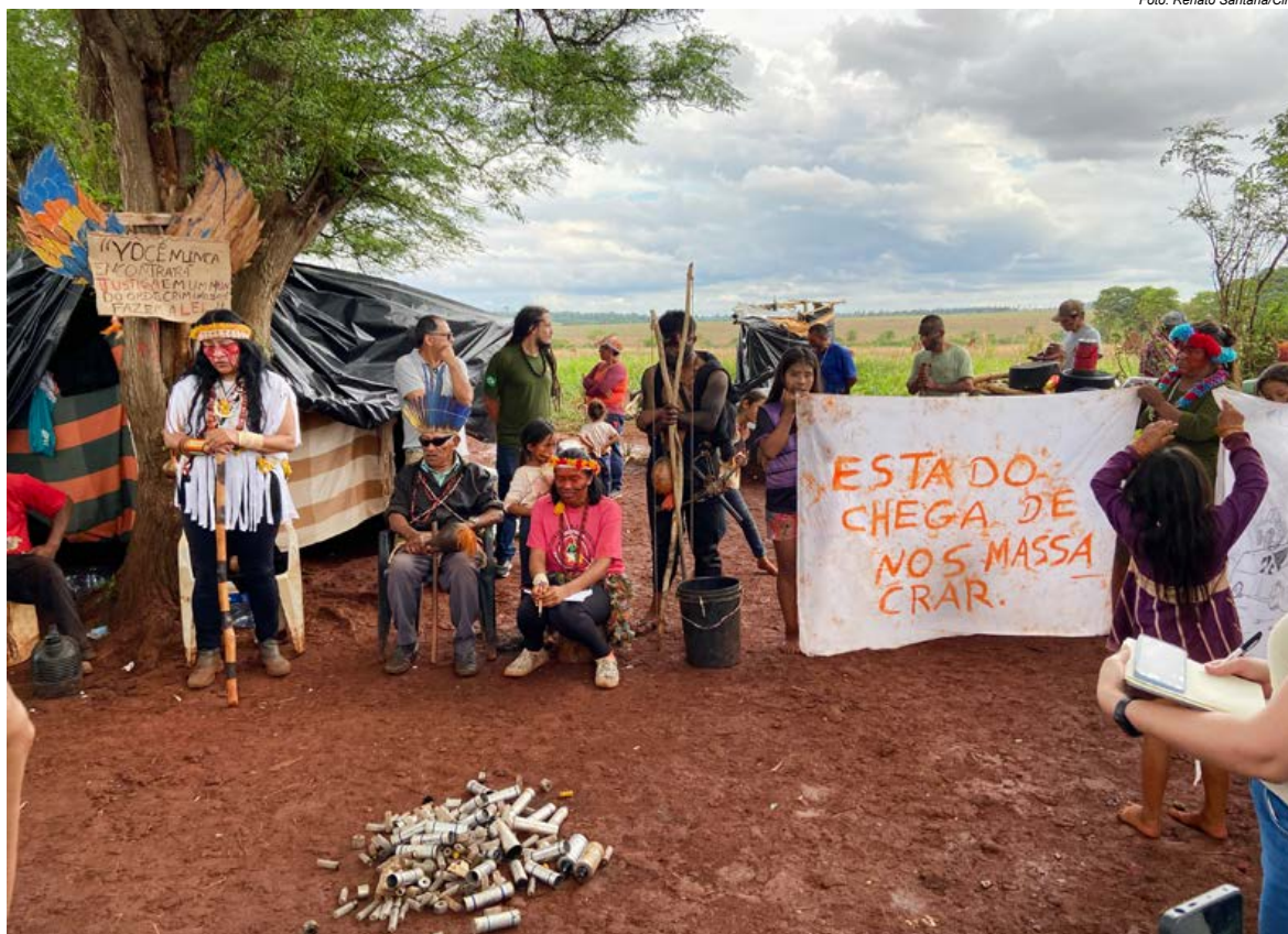
A retomada da TI Guyraroká vem sofrendo uma série de violências desde o dia 21 de setembro: foram quatro ataques policiais e incontáveis agressões agromilicianas

“Precisamos que as autoridades competentes prestem socorro ao povo Guarani e Kaiowá no Mato Grosso do Sul. Não é de hoje que a polícia pratica essa violência em nossos territórios (...) nosso governo do estado não