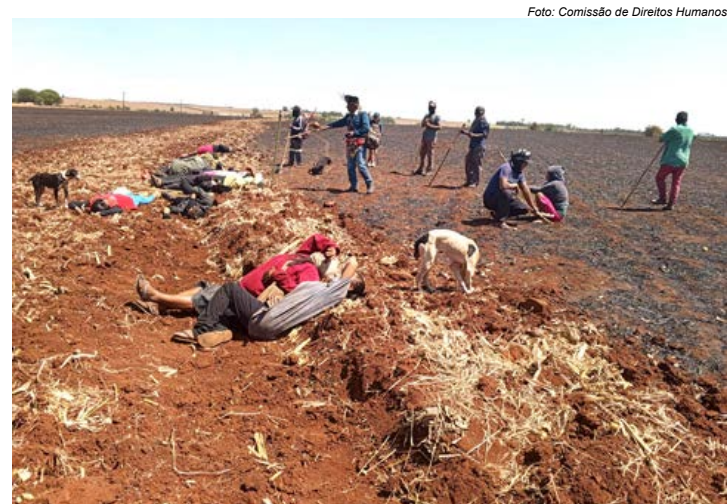
Indígenas feridos, intoxicados por gás e espancados aguardam socorro em área retomada na TI Guyraroká

“Desde que retomaram, as famílias indígenas, composta por crianças e idosos, têm sofrido ataques ilegais das forças de segurança do Estado que sem nenhuma reintegração de posse ou mandato judicial atacaram os indígenas e destruíram seus barracos que estavam sobre o campo como elemento para impedir o plantio e o consequente envenenamento. A polícia foi extremamente truculenta, deixando dezenas de feridos e enterrando pertences e os poucos alimentos que a comunidade possuía”, relata Cimi/MS.