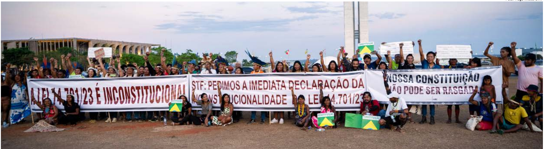
Lideranças indígenas de Rondônia e da Bahia em ato em defesa dos direitos constitucionais indígenas na Esplanada dos Ministérios