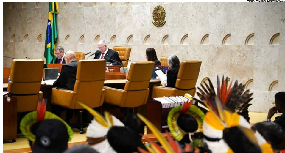
Ao atual presidente do STF, ministro Edson Fachin, relator do Tema 1031, as lideranças indígenas dos povos Kaingang, Xokleng, Guarani e Kaiowá solicitaram que o processo seja incluído na pauta de julgamento da Corte com urgência