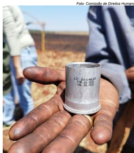
Os Guarani e Kaiowá recolheram projéteis e bombas de gás estouradas