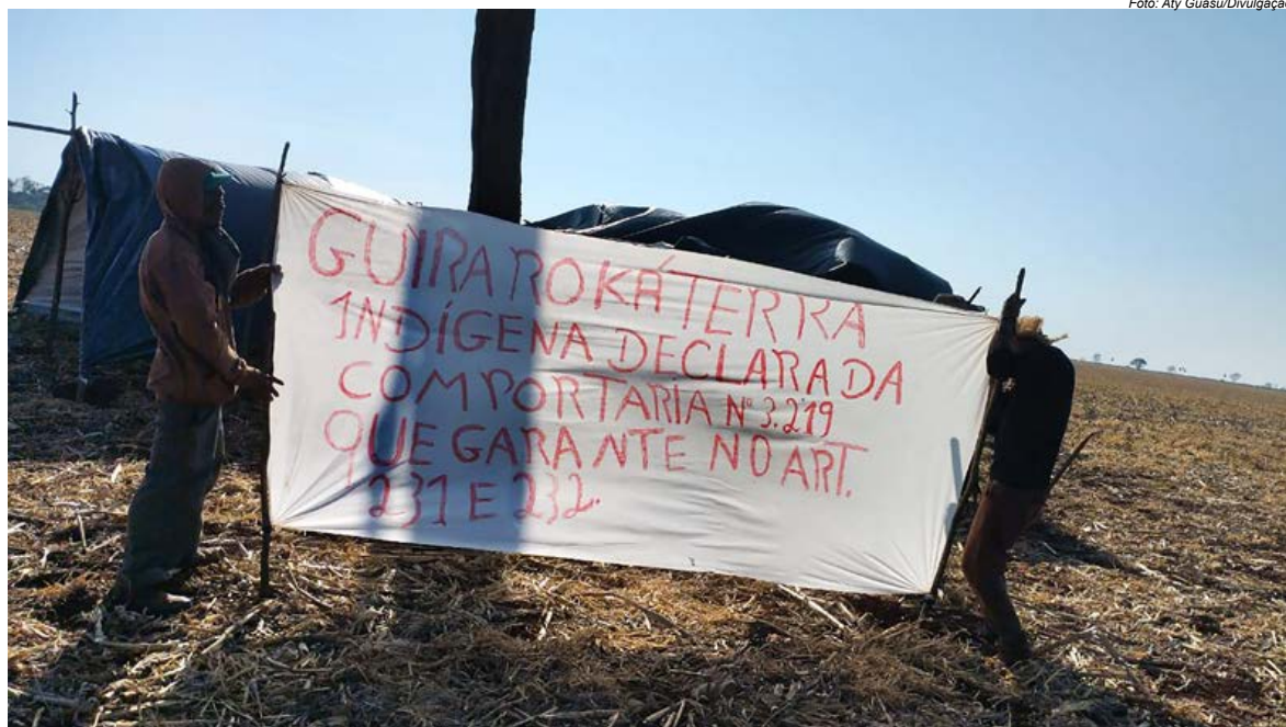
Os Guarani e Kaiowá reivindicam a demarcação da TI ao mesmo tempo em que visam impedir pulverizações de agrotóxico

A violência que levou ao sequestro, entretanto, não é um fato isolado. Ela integra o mesmo sistema de agressões