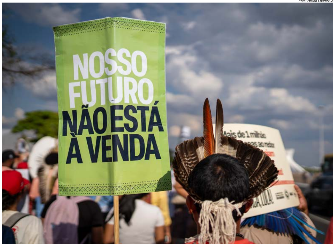
Em Brasília (DF), o Ato “Demarca, Lula” reuniu cerca de 200 indígenas no dia 13 de outubro para pedir que o presidente Lula conclua a demarcação das Terras Indígenas pendentes até a COP 30

O Brasil chega à COP 30 no momento de maior retrocesso na política indigenista e na política ambiental desde a Constituição de 1988. A demarcação dos territórios indígenas, política fundamental para o enfrentamento do colapso ambiental, permanece estagnada pela vigência da Lei 14.701, flagrantemente inconstitucional, que inviabiliza as demarcações e abre os territórios à exploração econômica de terceiros. Ao mesmo tempo, o avanço no Congresso do PL 2159/2021, o chamado “PL da Devastação”, desmantela a política de proteção ambiental. A COP 30 se instala, justamente, neste contexto de profunda e inaudita desconfiguração dos direitos territoriais dos