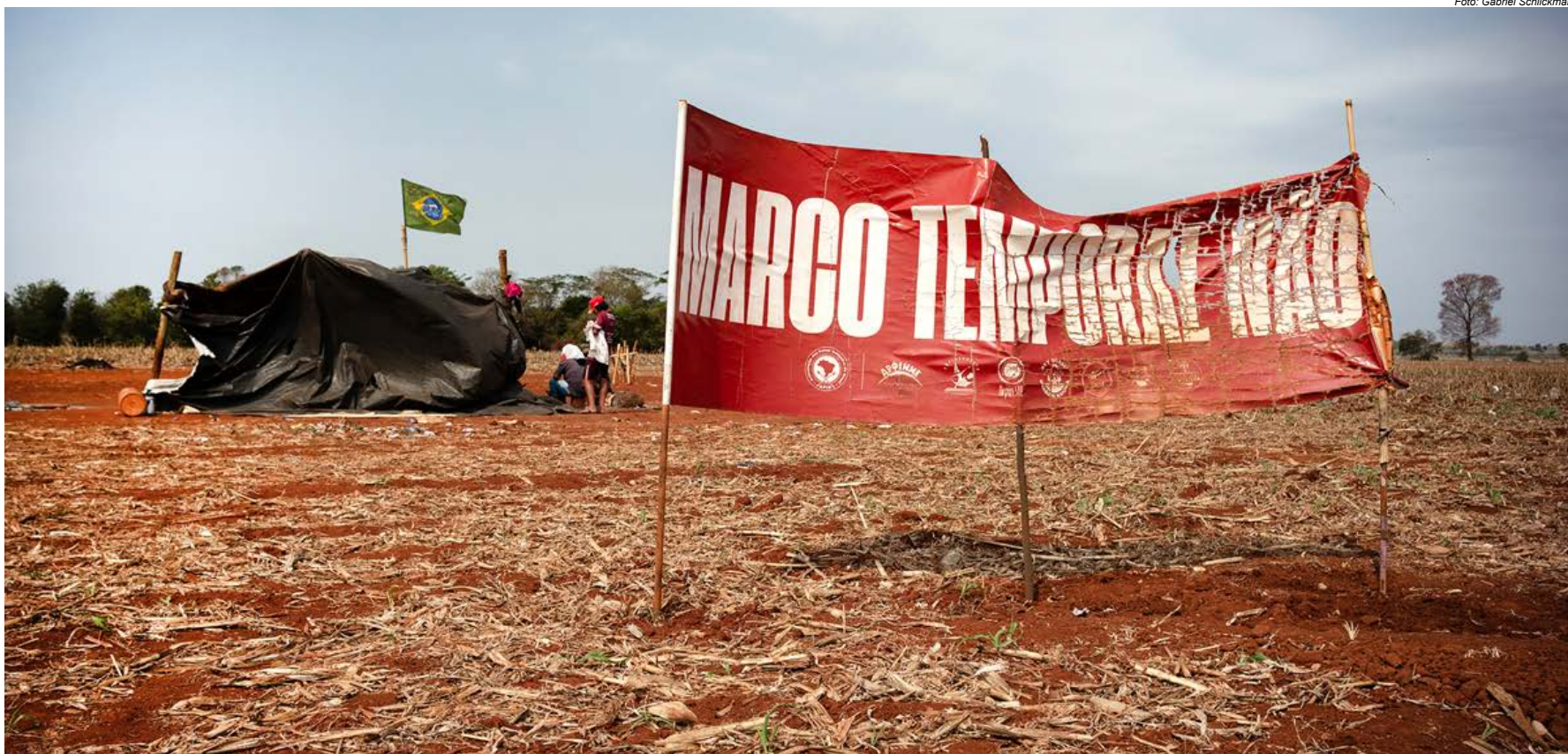
"Marco temporal não": faixa em retomada na TI Panambi – Lagoa Rica, em Douradina (MS), que esteve sob ataque contínuo em 2024