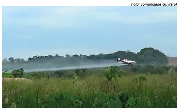
Aviões de fazendeiros, instalados em área dos Guarani Kaiowá, em Guyraroká, lançam agrotóxicos sobre plantações

A Fazenda Ipuitã, sobreposta ao território tradicional, tem sido acusada há anos de utilizar veneno como arma