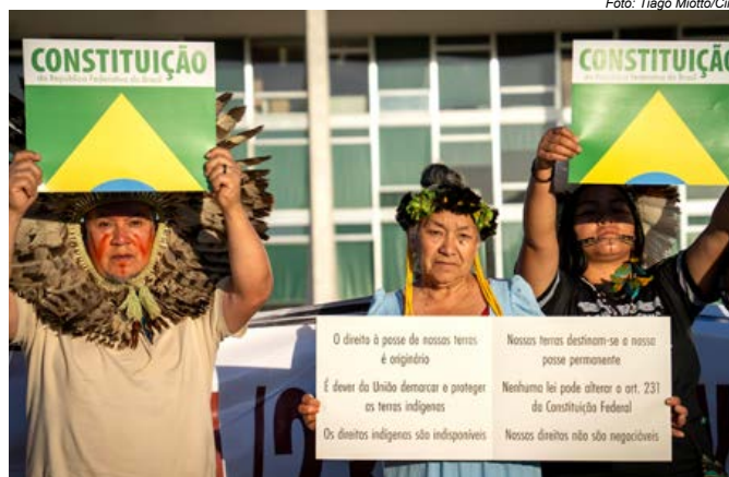
Lideranças Kaingang, Xokleng, Guarani e Kaiowá realizam ato em frente ao STF em defesa de seus direitos constitucionais e originários

As mobilizações foram realizadas no mês de aniversário de 37 anos da Carta Magna e também marcaram os dois