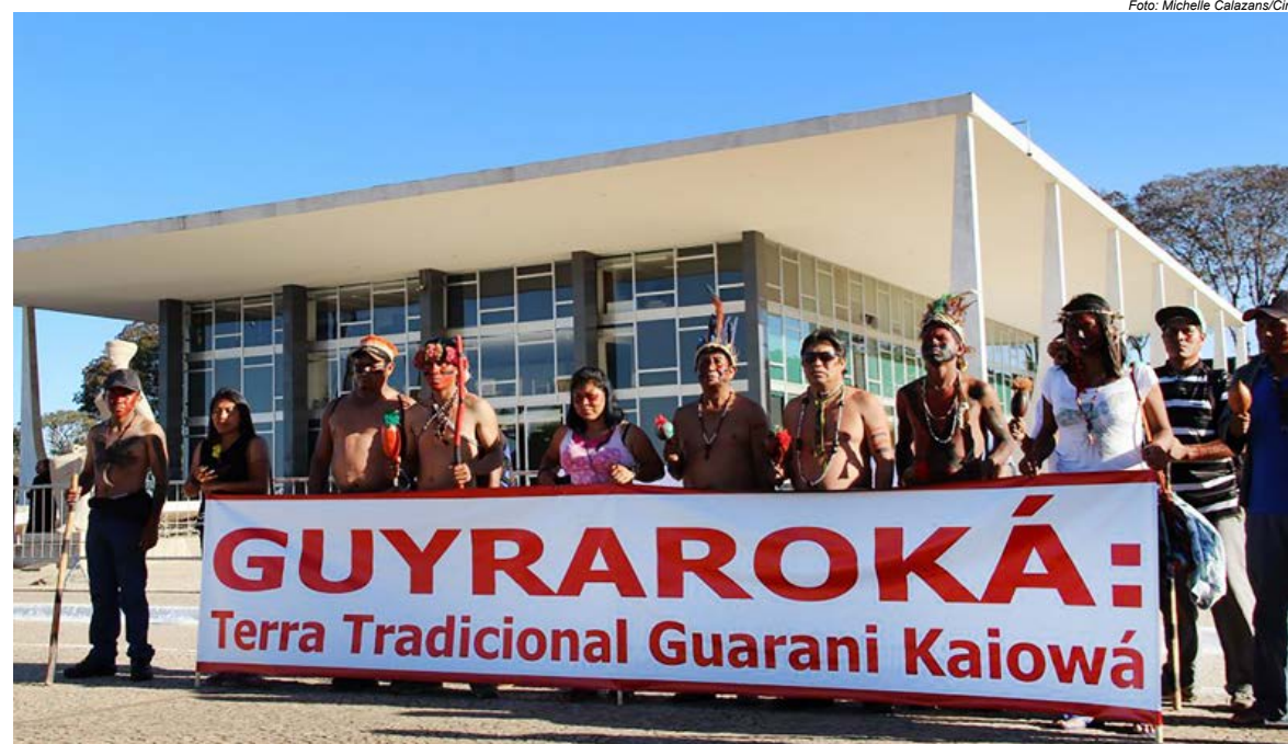
Manifestação Guarani e Kaiowá em frente ao Supremo Tribunal Federal

Desde 21 de setembro de 2025, quando famílias Guarani e Kaiowá retomaram parte da Fazenda Ipuitã, localizada dentro dos limites da Terra Indígena Guyraroká, a ação teve como objetivo impedir a pulverização de agrotóxicos sobre áreas habitadas e cultivadas pelos indígenas. As denúncias sobre o uso indiscriminado de veneno na região, remontam a pelo menos 2019 e incluem pulverizações aéreas e terrestres que atingem casas, plantações e até a