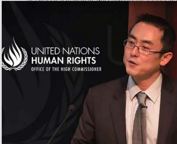
Obokata reuniu-se com diversos povos indígenas ao longo de sua missão