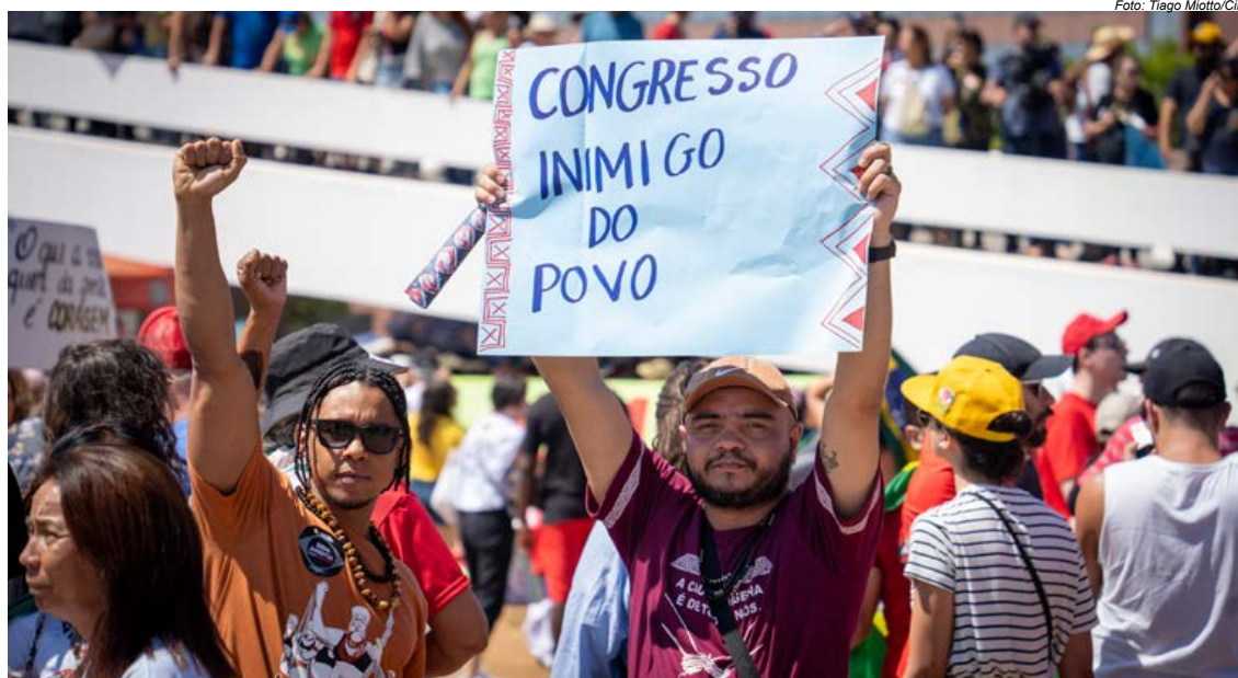
Ato contra a PEC da Blindagem, sem anistia para golpista

Conforme alerta o relatório, “a falta de um processo abrangente de Justiça de Transição para lidar com as consequências da ditadura levou, lamentavelmente, a ataques recorrentes à democracia, aos direitos humanos e ao Estado de Direito”. Para reverter esse cenário, Duhaime sustenta que o Brasil deve implementar com urgência o conjunto de medidas de Justiça Transicional propostas pela CNV.