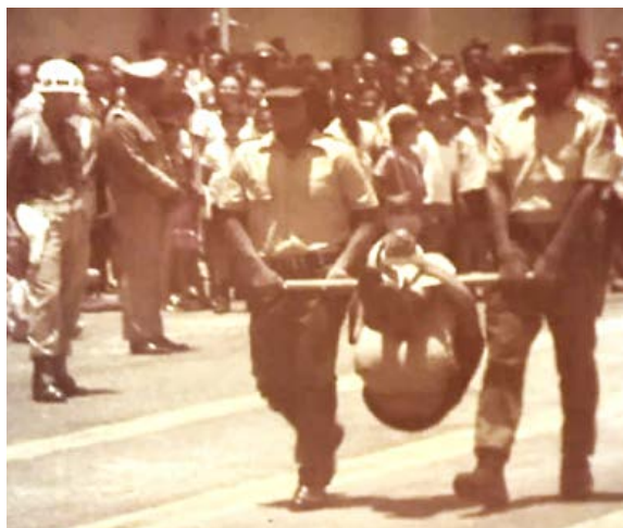
Cena do filme Arara de Jesco Von Puttmaker : desfile militar simula indígena em um instrumento de tortura, o pau-de-arara

Documentos históricos do Arquivo do Senado mostram que a ditadura se empenhou na criação do Estatuto do Índio em resposta a acusações internacionais de genocídio. Para os militares, a lei serviria para neutralizar denúncias reiteradas de jornais, políticos e organismos estrangeiros.