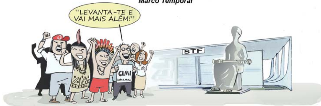
Marco contra o Autoritarismo