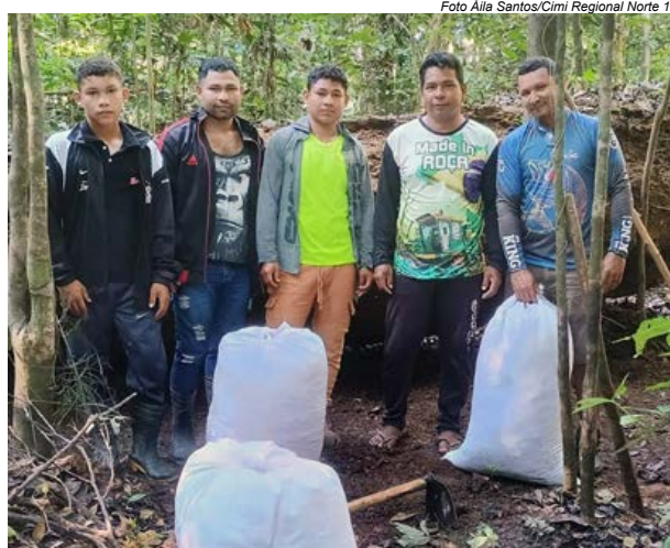
Jovens coletam paú, adubo da floresta para os canteiros