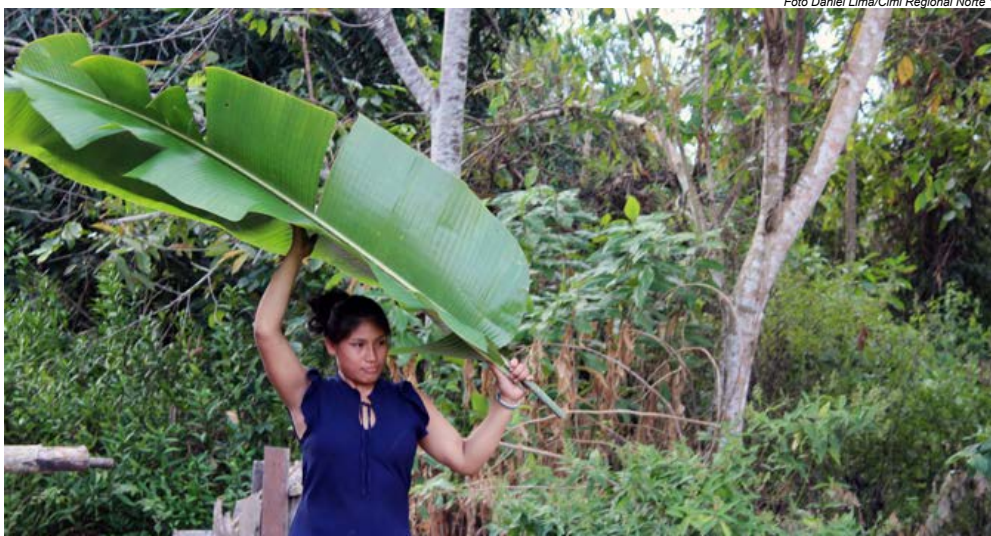
Folha de bananeira para proteger a horta