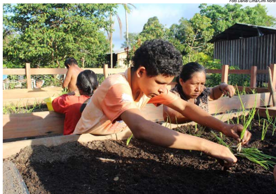
Jovens Apurinã semeando hortaliças