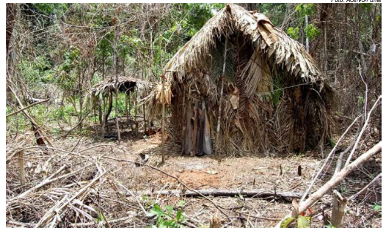
Maloca do "Índio do Buraco"