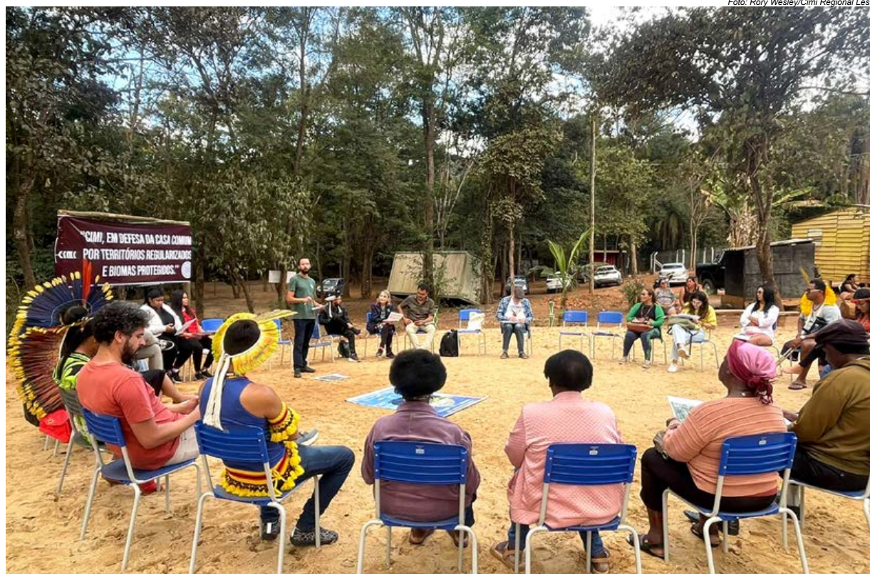
Povos indígenas e quilombolas participaram de encontro formativo na Aldeia Não Xohã – Sucupira, em São Joaquim de Bicas (MG)