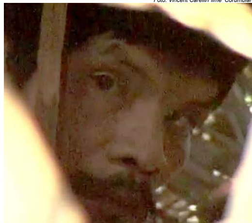
Registro de Tanaru no filme "Corumbiara" (2009)

"A exigência do reconhecimento estatal como requisito para o acesso a direitos configura-se como uma barreira institucional para o exercício da cidadania e confunde-se com a antiga política tutelar não recepcionada pela Constituição Federal de 1988. O texto constitucional trouxe um novo entendimento sobre os processos individuais e sociais a respeito da construção e formação de identidades étnicas ou de pertencimento de povos, reforçando a autonomia das comunidades indígenas", diz a nota.