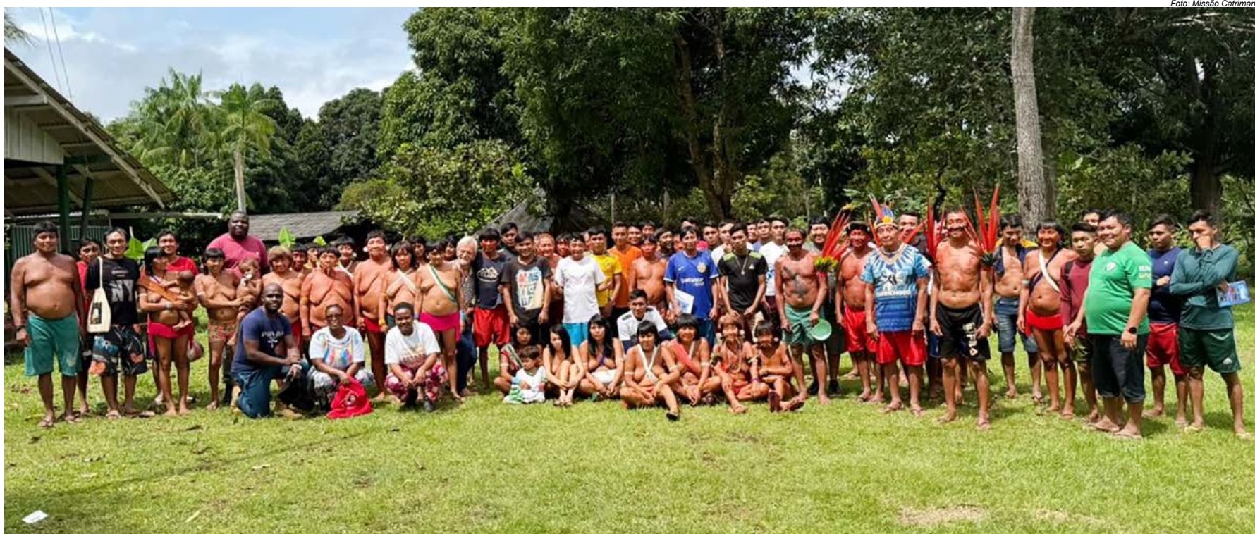
Fundada em 1965, a Missão Catrimani representa um modelo de presença respeitosa entre os povos indígenas