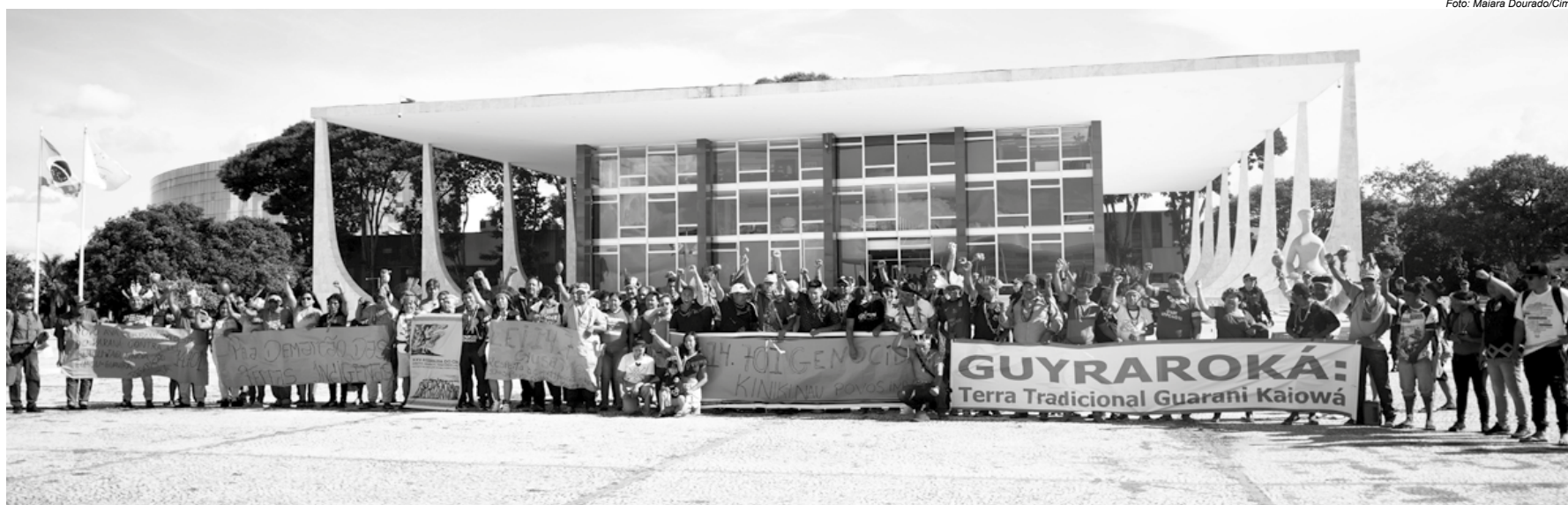
Indígenas dos povos Avá-Guarani, Guarani e Kaiowá, Terena, Kinikinau e Kadiwéu em ato em frente ao STF contra a Lei do Marco Temporal