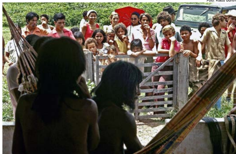
Depois de capturados, os Avá-Canoeiro foram expostos em um cativoiro à população local

Em 2012, a TI Taego Áwa foi identificada e delimitada pela Funai com 29.390 hectares tradicionalmente ocupados pelos Avá-Canoeiro, na região do médio curso do rio Araguaia, no Tocantins. O território fica localizado à margem direita do rio Javaés, a leste da Ilha do Bananal.