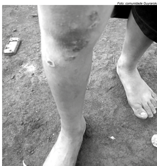
Feridas ocasionadas pelo contato permanente com agrotóxicos pulverizados nas plantações que fazem limite com a aldeia Guyraroká

Houve casos em que a pesquisa desenvolvida pela parceria de instituições sul-matogrossenses encontrou 11 agrotóxicos em uma mesma porção de água em Guyraroká. “É uma quantidade absurda”, considera a pesquisadora. O estudo encontrou 20 tipos diferentes de agrotóxicos nas águas da comunidade, a maioria deles em combinação com outros. “Foram 32 amostras no total. Em somente