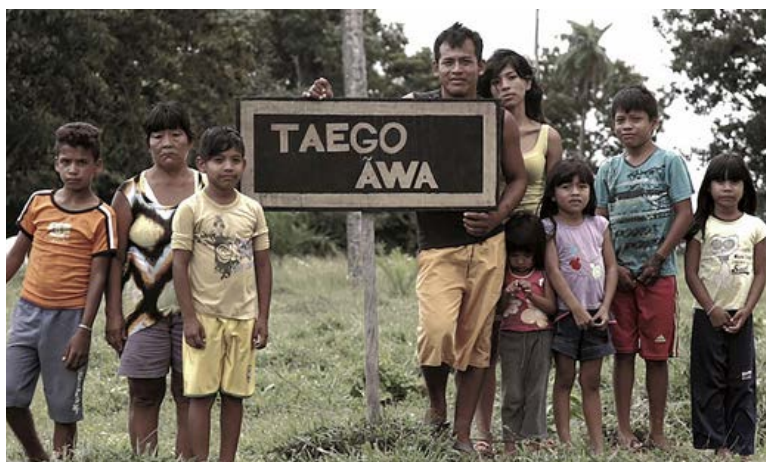
Cena do filme Taego Áwa. Capão de Areia, Vinicius Berger, 2015

As duas fazendas cujos proprietários questionam a demarcação da TI Taego Áwa, segundo as pesquisadoras, também foram desmembradas da Fazenda Canuanã, adquirida pela Fundação Bradesco à época do contato com os Áwa. A constituição da fazenda e apropriação privada do território é caracterizada pelo juiz federal de Gurupi como um processo de “esbulho”.