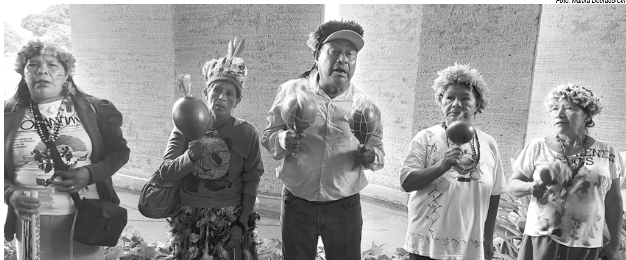
Indígenas do Mato Grosso do Sul e do Paraná em frente ao Ministério da Justiça, em Brasília