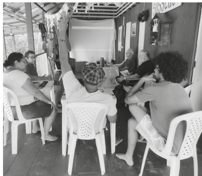
Integrantes da Eapil, do Conselho Indigenista Missionário

Diante dos levantamentos e diálogos, foi definido que haverá um foco prioritário aos povos Piripkura, do Rio Pardo (MT), e Xinane, do Acre. Ambos têm sido alvos constantes de madeireiros e grileiros – entre outros tipos de invasores. Outro trabalho a ser realizado será o levantamento dos impactos nos territórios indígenas onde vivem os povos isolados, devido à construção da estrada de Cruzeiro do Sul a Pucallpa, no Peru, bem como de uma hidrovía.