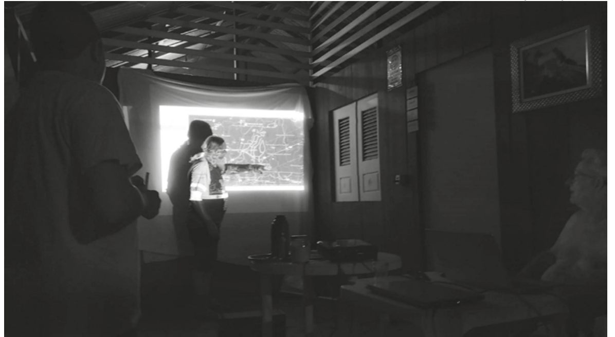
Apresentação durante a reunião da Eapil

De acordo com a Eapil, a denominação “isolados” não é a mais adequada para nos referirmos a esses indígenas. “O uso dessa denominação se dá tão somente por falta de uma conceituação que os identifica de forma apropriada.