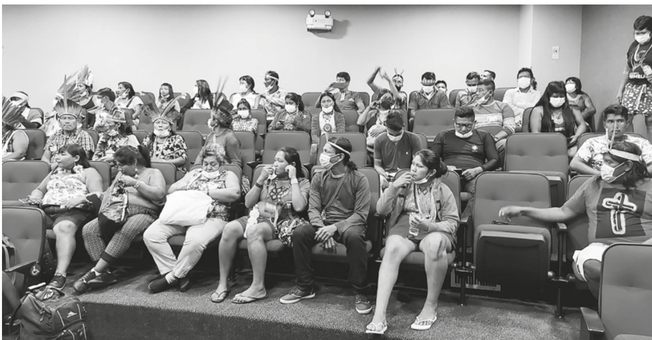
Indígenas foram conduzidos ao auditório da Sesai, após manifestação

Assim, caso o PLOA 2023 seja aprovado como está, a retomada da política indigenista enfrentará sérios desafios, independente de quem seja o mandatário do país no próximo período. A necessária reestruturação e redirecionamento do órgão esbarrará no quadro de servidores desfalcado, sem plano de carreiras e proteção adequados para executar sua missão, além de um orçamento exíguo e ainda mais apertado do que o deste ano.