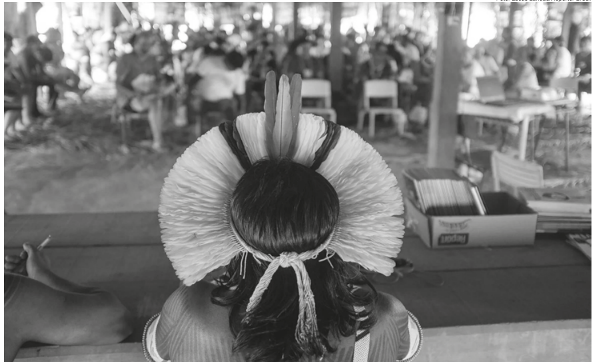
Expulsar invasores dos territórios foi elencado por associações indígenas como uma das ações prioritárias do governo Lula; os Kayapó (foto) sofrem com garimpeiros que ameaçam várias de suas aldeias, mas há outros povos cujas terras vêm sendo invadidas por madeireiros ilegais e grileiros