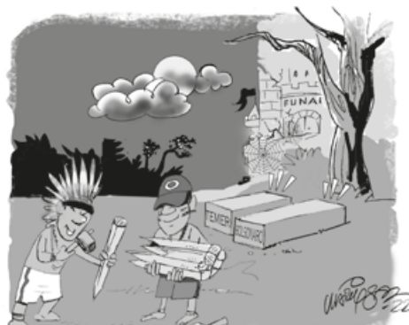
- Em 2023 vamos demarcar muito e recuperar a FUNAI...