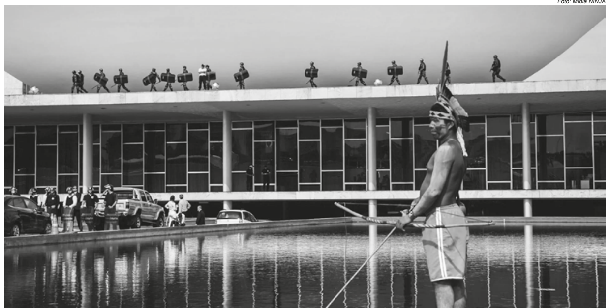
Lideranças reforçam que o próximo governo precisa ter claro a importância de as decisões serem tomadas sempre em conjunto com representantes dos povos originários

Em novembro, os olhares do mundo se voltaram à COP-27, que ocorreu em Sharm El Sheikh, no Egito. Para o Brasil, essa edição contou com a presença do presidente eleito Lula e