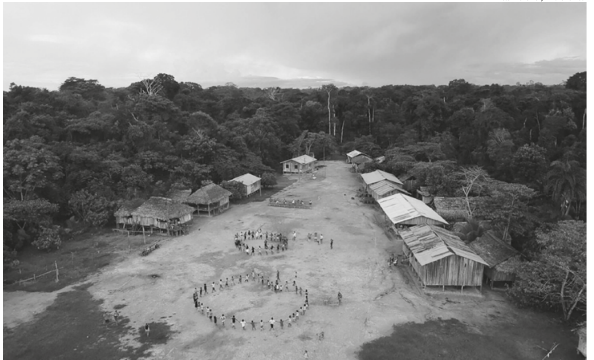
Aldeia Massapê, do povo Kanamari