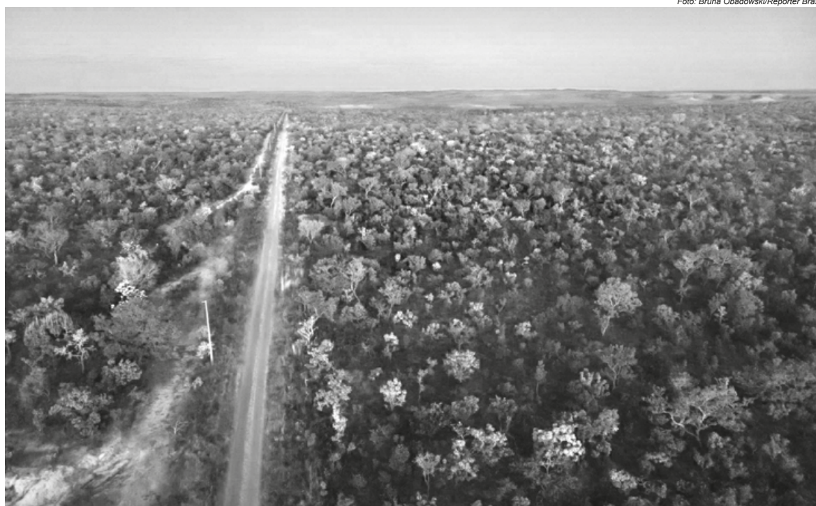
Cortes severos no orçamento da Funai e sua militarização impacta diretamente a vida as aldeias, prejudicando, por exemplo, a segurança dos indígenas em isolamento voluntário; territórios também ficam mais propensos a invasões, que podem começar com a abertura de estradas, como no caso da terra indígena Parabubure