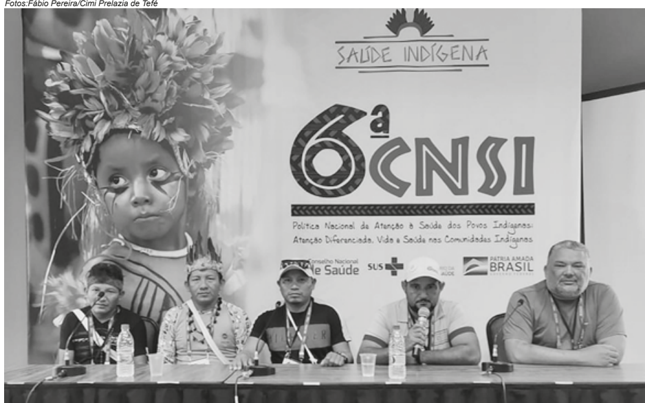
Conferência Nacional de Saúde