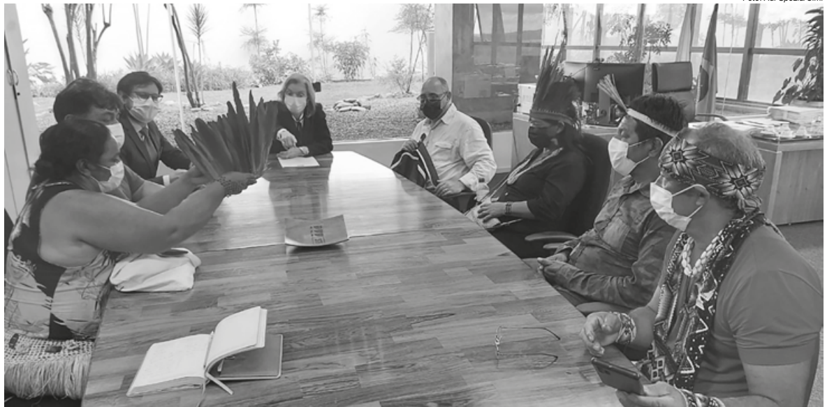
Delegações de 21 povos indígenas do Acre, Goiás, Tocantins e Santa Catarina e representantes do Cimi são recebidos pela ministra do STF Cármen Lúcia

O julgamento do RE 1.017.365, pelo STF, é de fundamental importância para salvaguardar os direitos territoriais dos povos indígenas no Brasil. “Hoje os kupen [os não indígenas] estão invadindo nossos territórios, os demarcados e ainda mais os não demarcados. Não queremos esse marco