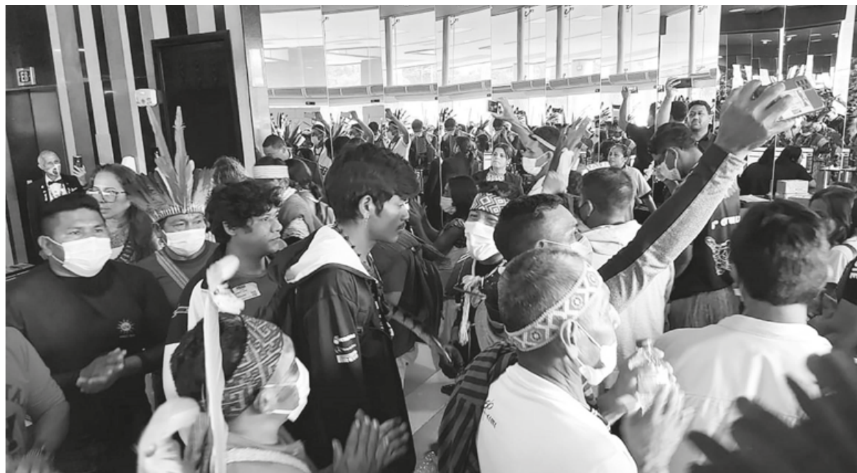
Mobilização das delegações indígenas na porta da Sesai