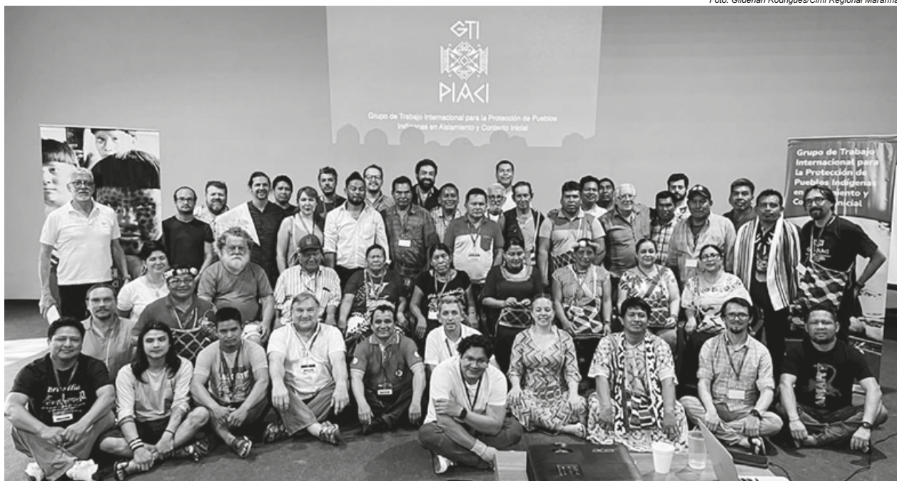
Representantes de oito países durante encontro do GTI-PIACI, no Paraguai