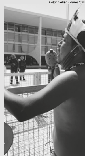
Acampamento “Luta pela Vida”

Nesse ambiente, a Funai, órgão indigenista oficial, tornou-se uma agência reguladora de negócios criminosos nos territórios demarcados ou em demarcação. O governo Bolsonaro naturalizou as violências praticadas por invasores para a extração de madeira, minério e para a prática do garimpo, e legalizou a grilagem e o loteamento das terras da União – afinal, as