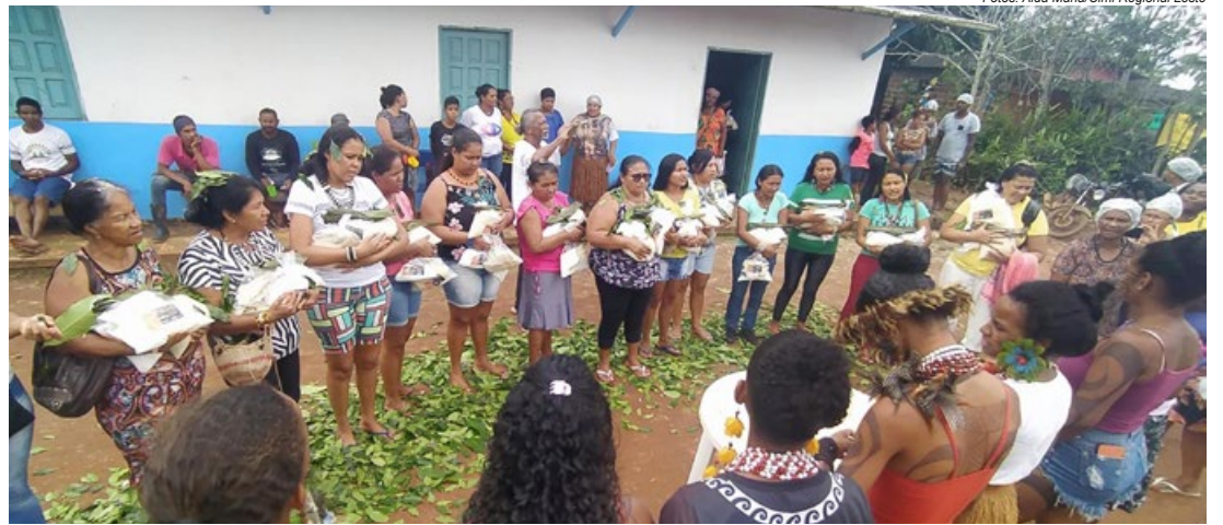
Produção da farinha de mandioca e entrega de presentes durante a 16ª Farinhada das Mulheres, realizada em novembro de 2022, no território Tupinambá de Olivença, no Sul da Bahia