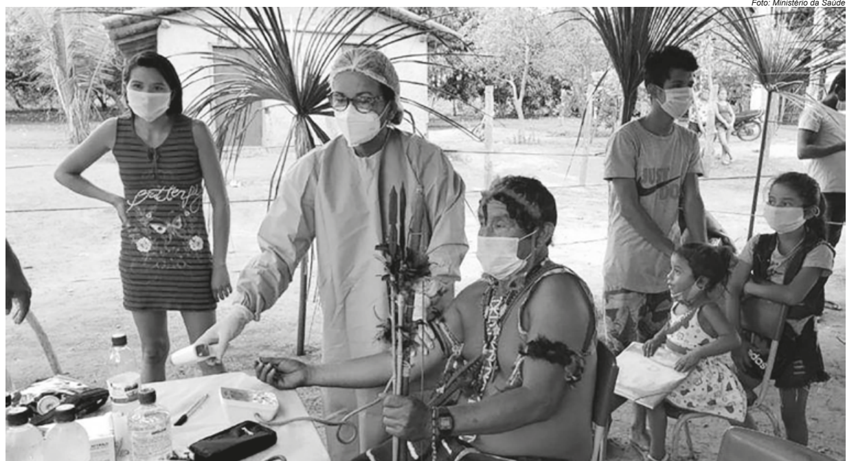
Indígenas foram conduzidos ao auditório da Sesai, após manifestação

A redução do orçamento para o Meio Ambiente expressa absoluta falta de prioridade dada a essa política. Se comparado ao PLOA 2022, o meio ambiente perde R$ 164 milhões no PLOA 2023. No total estão previstos R$ 2,96 bilhões para todas as Unidades Orçamentárias que compõem a pasta Meio Ambiente