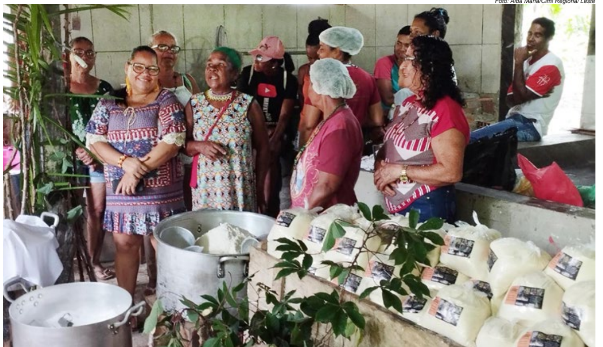
A Farinhada das Mulheres tem como objetivo favorecer a auto-organização, a autonomia e a valorização do trabalho das mulheres envolvidas no projeto

“Destacamos a importância destes momentos, não só para pensar em saídas econômicas e sociais, mas também sobre o valor e a importância na saúde mental e no cuidado do bem estar e da valorização psicossocial das mulheres quando participam destes movimentos”, finalizou o coordenador do Cimi Regional Leste.