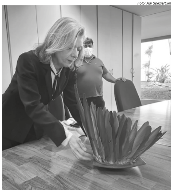
Ministra Cármen Lúcia, do STF, recebe lideranças indígenas em seu gabinete na tarde da quarta-feira, 7 de dezembro de 2022

A delegação que está em Brasília é composta por mais de 80 lideranças, dos povos: Jaminawa, Apurinã, Kanamari, Nawa, Nukini, Manchineri, Kuntanawa, Sharanawa, Shanenawa, Apolima-Arara, Huni Kuin, Jamamadi, Apinajé, Karaja, Krahô, Xerente, Krahô Kanela, Kanela do Tocantins, Takaywrá, Tapuia e Xokleng. No entanto, uma representação desses 21 povos, – de quatro estados: Acre, Santa Catarina, Goiás e Tocantins – que compõe a delegação, foi elencada para a audiência com a ministra Cármen Lúcia, e o protocolo dos documentos junto aos gabinetes dos ministros da Suprema Corte.