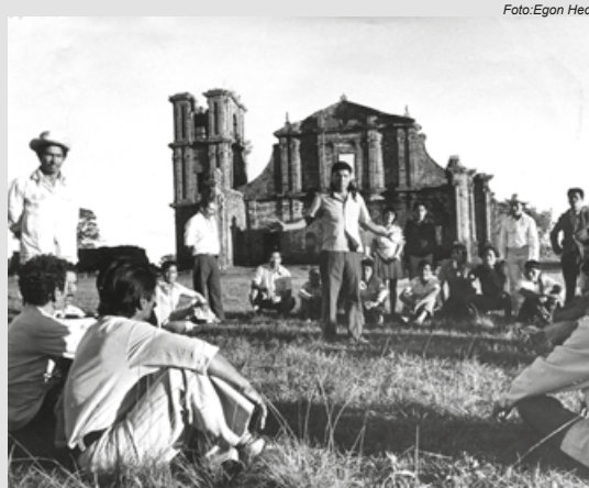
Assembleia Indígena, Ruínas de São Miguel/RS, 1977

Desta forma, cada vez mais, pequenos grupos puderam ir se apossando da compreensão do Estado, do funcionamento da sociedade, de seus direitos. Nos Territórios, as conversas e análises maturadas com os indígenas foram se transformando em materiais de denúncia nacional e internacional. Através de textos, matérias jornalísticas, vídeos e etc, o Cimi/MS foi ajudando os povos indí-