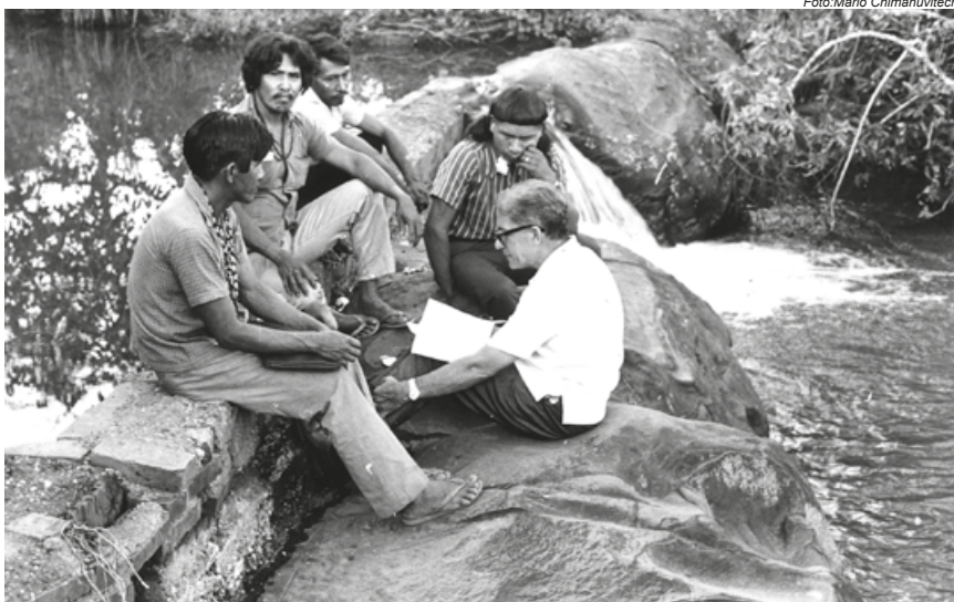
Assembleia Indígena, Mato Grosso, 1974