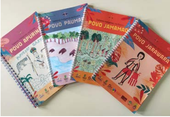
Livros didáticos produzidos pelos professores indígenas dos povos Jamamadi, Apurinã, Jarawara e Paumari