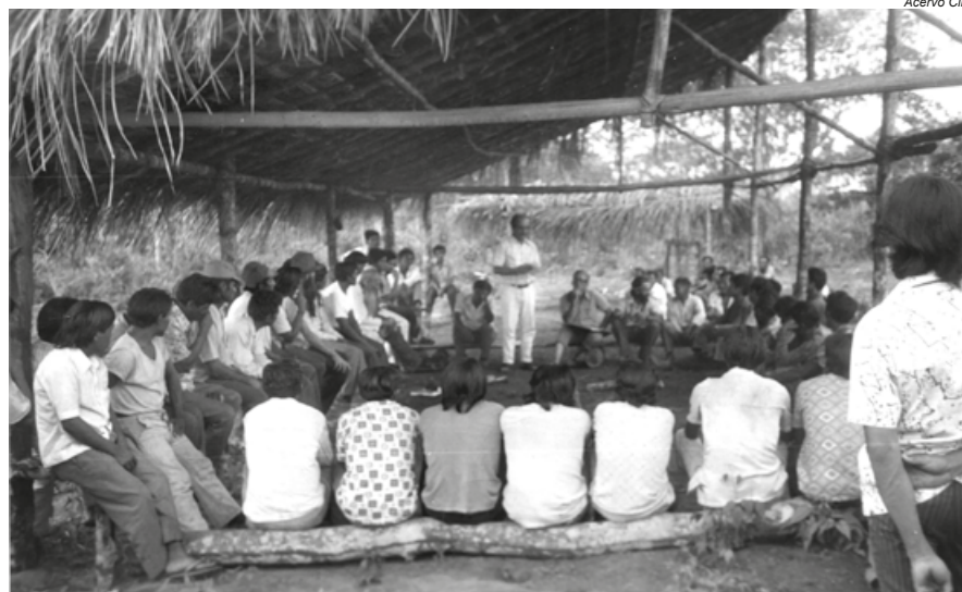
Assembleia Indígena, Rio Cururu/PA, 1975