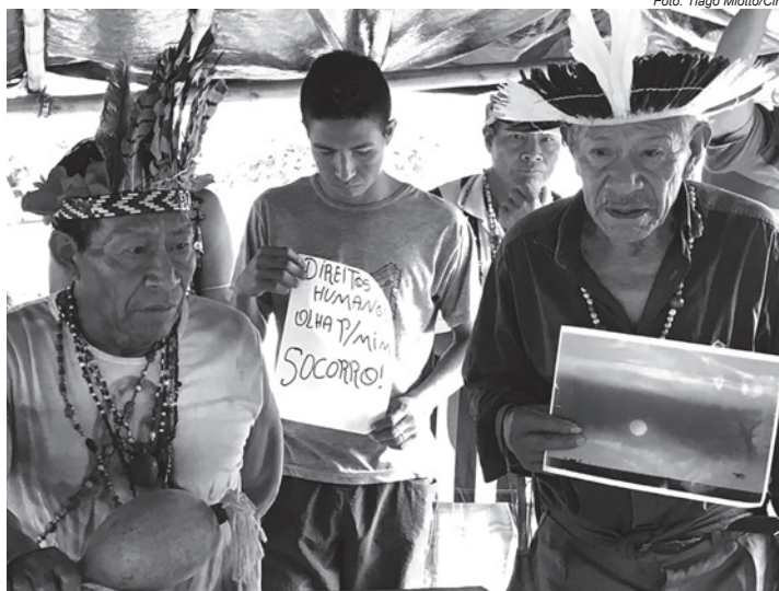
Indígenas Guarani kaiowá fortalecem reivindicação contra violação de direitos humanos em visita da Delegação da CIDH

“Muitas dessas pessoas, por conta da discriminação baseada na origem étnico-racial, acabam em um ciclo de pobreza que as impele a situações habitacionais extremamente precárias e, por consequência, as expõem à violência perpetrada por grupos e organizações criminosas”, destaca o documento, que expõe um país que internacionalmente vem sendo criticado por adotar práticas que contrariam tudo que dispõe os Direitos Humanos.