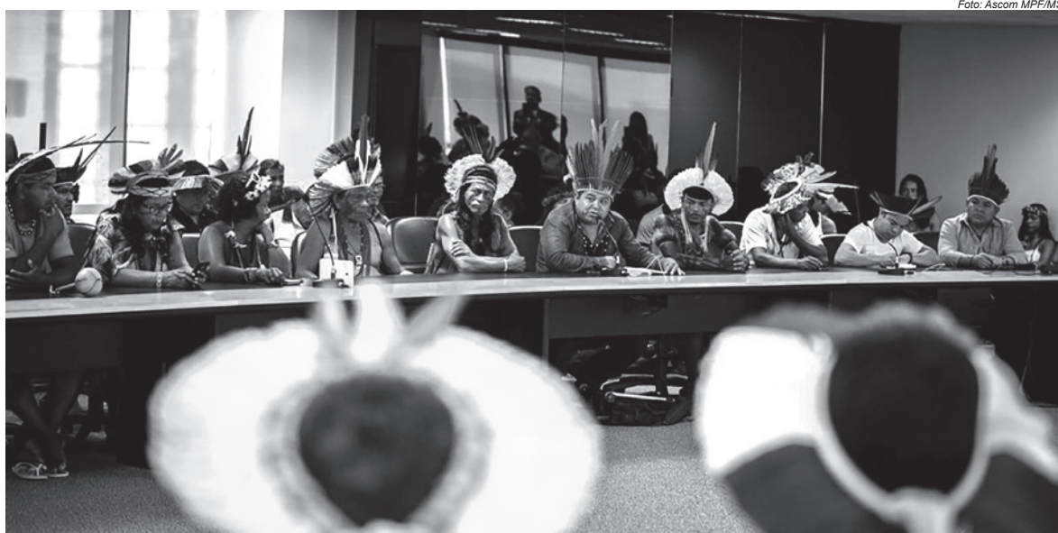
Em outubro de 2019, lideranças dos povos Pataxó e Tupinambá, da Bahia, dos povos Macuxi, Wapichana e Aturau, de Roraima, e do povo Xavante, de Mato Grosso, participaram de Audiência Pública na Ordem dos Advogados do Brasil (OAB), em Brasília, e, junto a representantes de organizações indigenistas e voltadas à defesa direitos humanos, debateram os caminhos e os desafios para a defesa de seus direitos originários

Outro cenário descrito no documento ocorreu no final de 2020, quando a grave situação nas TIs Yanomami e Munduruku levou a Comissão Interamericana de Direitos Humanos (CIDH) a emitir medidas cautelares em favor dos povos que habitam estes territórios. Segundo a CIDH, os Yanomami e os Ye'kwana estão “em situação grave e urgente, pois seus direitos correm risco de danos irreparáveis”. O organismo ligado à Organização dos Estados Americanos (OEA) também pediu ao Estado providências para a proteção dos Munduruku, em situação de risco no contexto da pandemia da Covid-19, “especialmente quando se considera a sua situação de particular vulnerabilidade, as falhas no atendimento à saúde e a presença de terceiros não autorizados no seu território”.