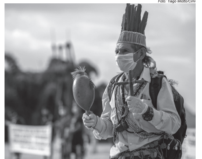
Rezador Guarani e Kaiowá durante protesto na manhã desta segunda (19) na Praça dos Três Poderes, em Brasília