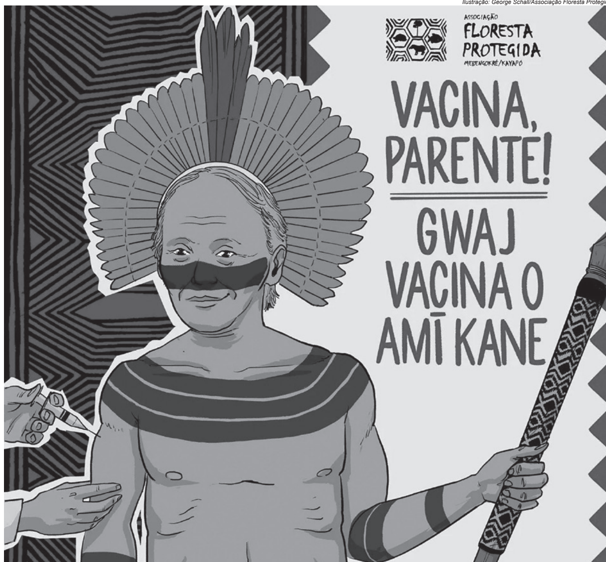
Associação dos Kayapó organizou campanha própria para estimular a vacinação (Ilustração)

Já a Secretaria de Saúde do Paraná afirmou, em nota, que mantém diálogo com o Dsei Litoral Sul e municípios para desenvolver ações de prevenção e controle, e que a vacinação dos povos indígenas ocorre “de forma satisfatória” no estado. Sobre os óbitos, a secretaria observou que os casos recentes afetam principalmente idosos acima de 70 anos, já que eles foram vacinados no início da campanha de imunização, o que aponta para a necessidade de revacinação do grupo.