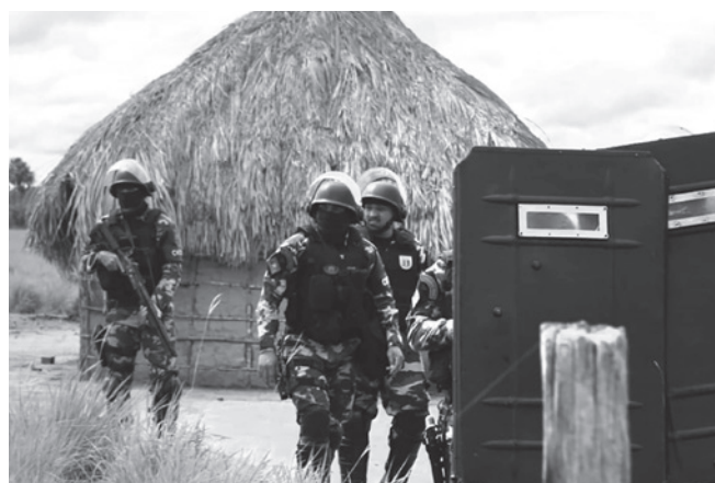
Em ação, PM usou bombas de gás lacrimogêneo, spray de pimenta e atirou com arma de balas de borracha contra a comunidade da TI Pium

Para o ministro, o risco de novas reintegrações de posse em meio à pandemia agravaria a situação dos indígenas, “que podem se ver, repentinamente, aglomerados em beiras de rodovias, desassistidos e sem condições mínimas de higiene e isolamento para minimizar os riscos de contágio pelo coronavírus”.