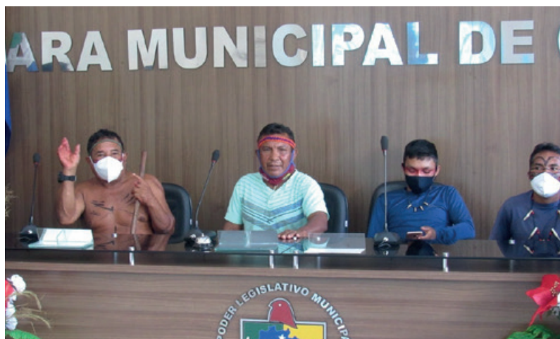
Lideranças dos povos Kanamari e Madija Kulina ocuparam as cadeiras dos vereadores e se auto intitularam “os verdadeiros representantes do povo”

“Adquirir esses conhecimentos e compreender a responsabilidade de cada órgão é fundamental para que os povos indígenas possam, com autonomia, cobrar e promover as incidências necessárias”