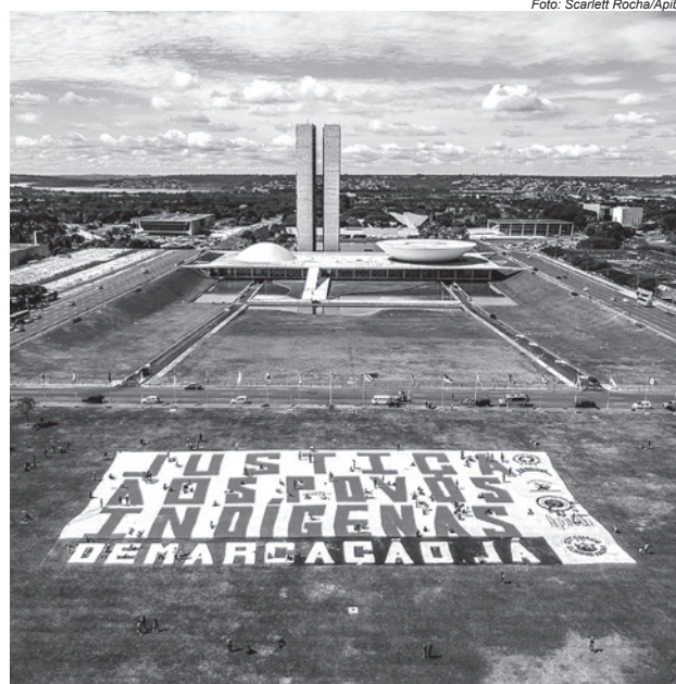
Indígenas estendem faixa na Esplanada dos Ministérios, em Brasília, no dia 15 de junho