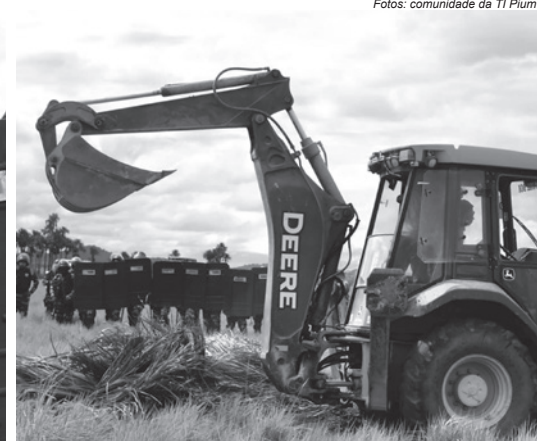
Durante ação de reintegração de posse, na TI Pium, tratores são utilizados para derrubar casas