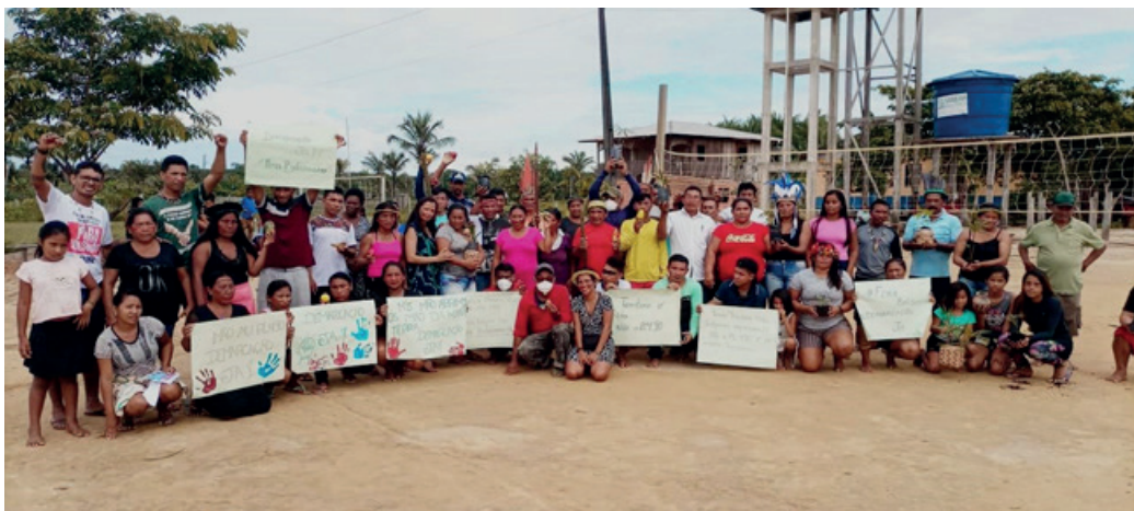
Indígenas dos povos Kanamari e Madija Kulina, da região do médio rio Juruá (AM), em encontro para debater as principais violações de direitos indígenas, em novembro de 2021