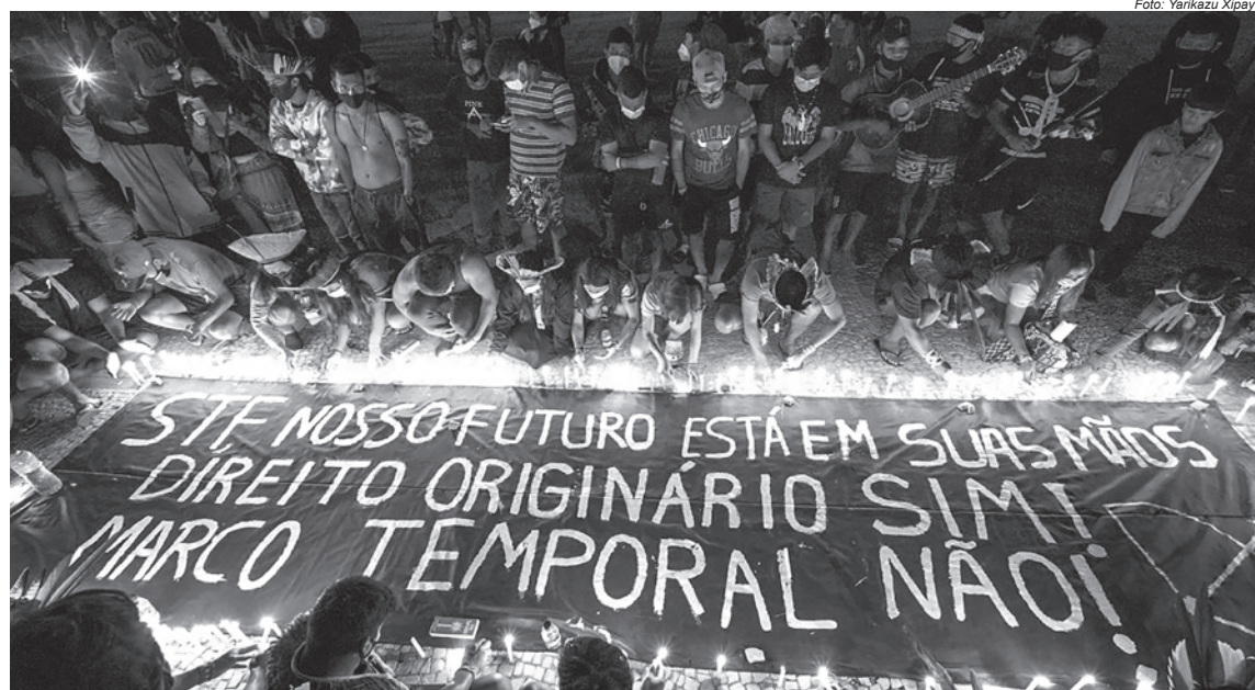
Durante Levante Pela Terra, em junho de 2021, povos indígenas realizaram vigília em defesa de seus direitos originários na frente do STF