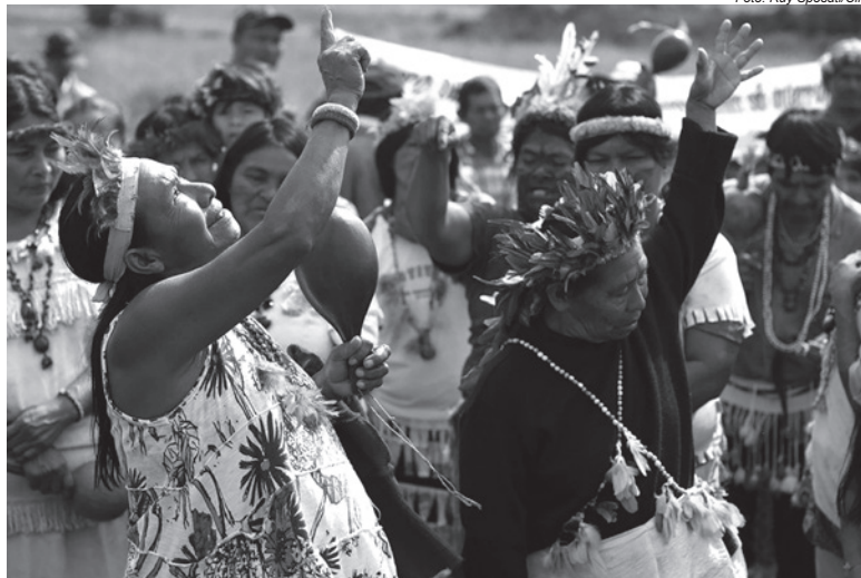
Mulheres Guarani e Kaiowá durante Aty Guasu

Com a decisão, o STF revalida o processo administrativo de demarcação, que já conta com decreto de homologação, publicado em dezembro de 2009. O decreto estava suspenso há quase 12 anos com base na tese do chamado marco temporal, defendida por ruralistas e setores interessados na exploração das terras tradicio-