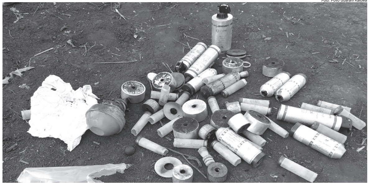
Retomada Avae'te, em Dourados, no Mato Grosso do Sul, novembro de 2021

“É complicado porque, vou te contar, a Polícia Militar é muito violenta com os indígenas, contra os Guarani Kaiowá. Estamos aqui sofrendo, violentados pela Polícia Militar assim como pelos pistoleiros dos fazendeiros”, reforça a liderança indígena.