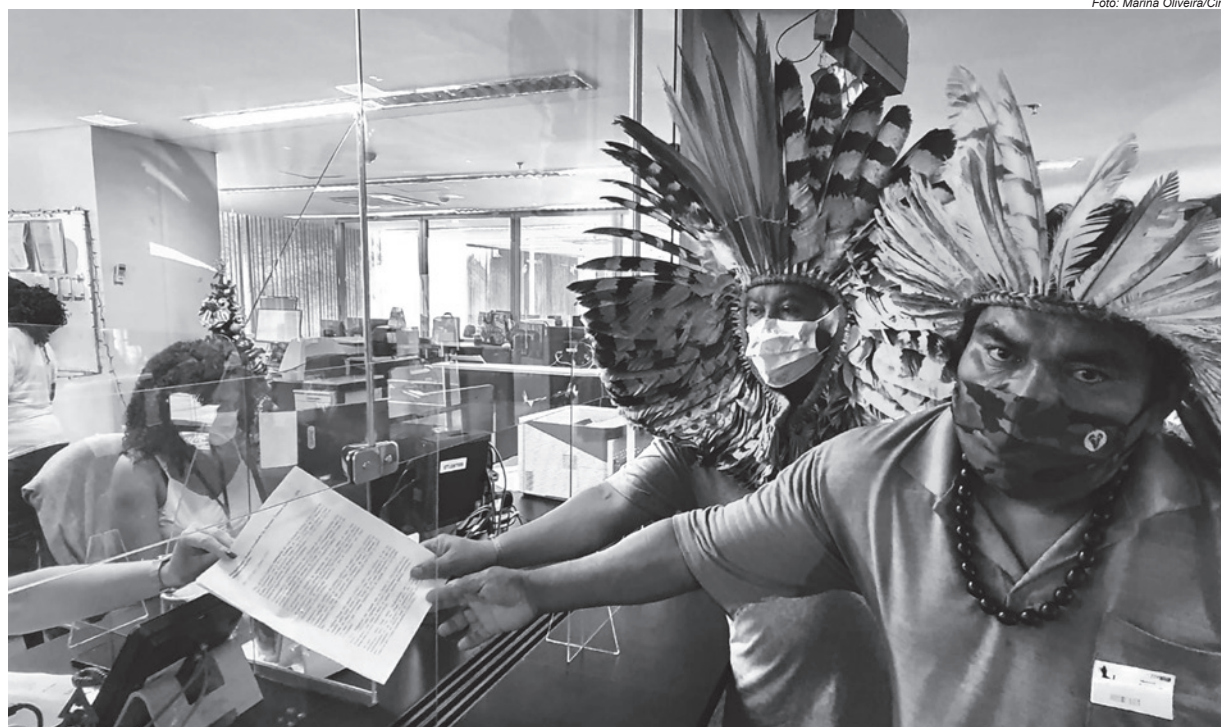
Lideranças indígenas protocolaram documento no STF pedindo ao presidente da Corte, Luiz Fux, que retome o julgamento do marco temporal

“O processo teve o julgamento suspenso por pedido de vista. Agora, diante da devolução do processo para