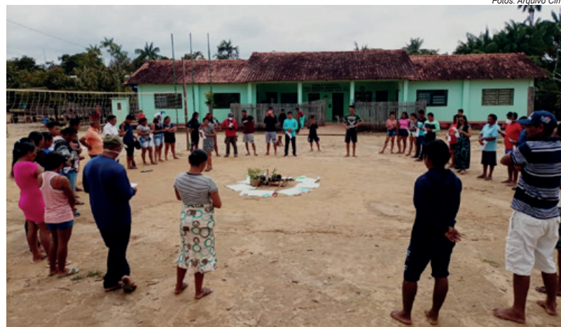
Durante o encontro dos povos Kanamari e Madija Kulina, do médio rio Juruá, foi elaborado um documento com as principais denúncias e reivindicações

→ o dever do Estado em realizar essas etapas da demarcação e homologação de suas terras foi o principal tema da oficina. Para o Conselho Indigenista Missionário (Cimi) e sua equipe na Prelazia de Tefé (AM), que promoveu a ação, “adquirir esses conhecimentos e compreender o funcionamento e responsabilidade de cada órgão é de fundamental importância para que os povos indígenas possam, com autonomia, cobrar e promover as incidências necessárias para a garantia da efetiva demarcação territorial”.