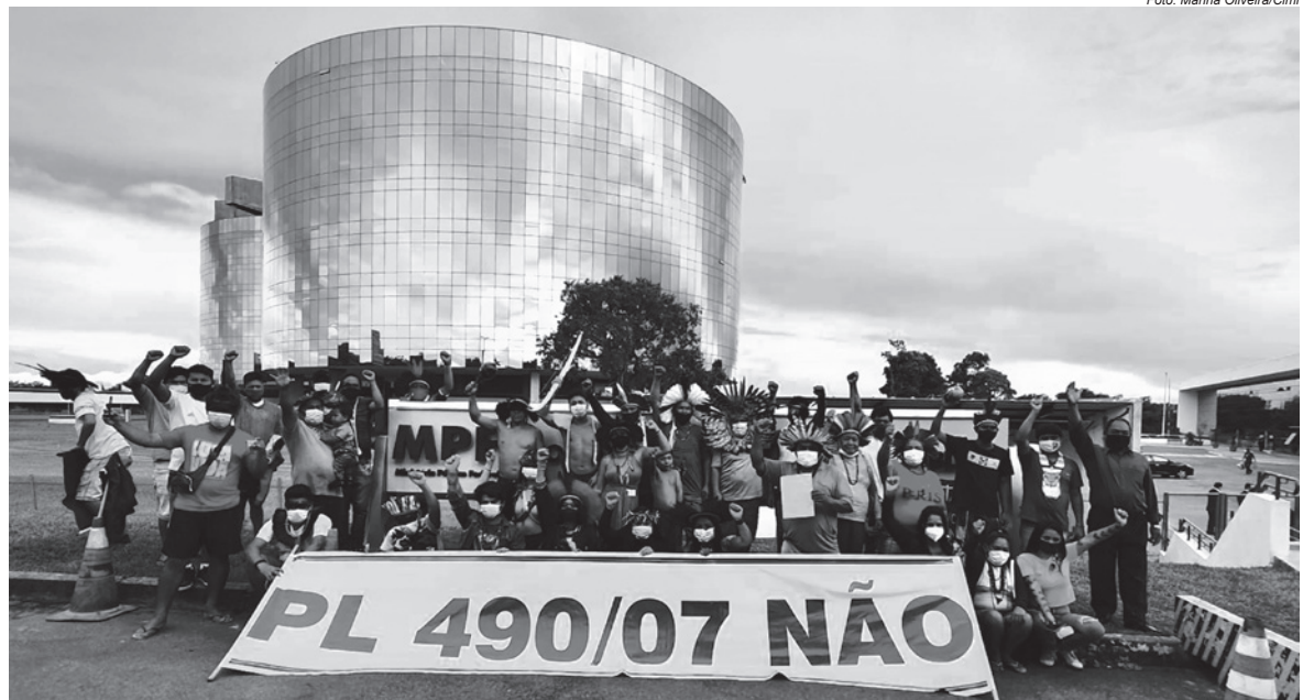
Na sede da Procuradoria-Geral da República, cerca de 60 indígenas de diversos povos também manifestaram contra o PL 490/2007

Os arrendatários utilizam a área para o plantio de grandes monoculturas, especialmente a soja – com graves