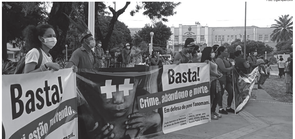
A mobilização visou chamar a atenção da sociedade e do mundo a respeito da política de genocídio contra o povo Yanomami

“Essa postura agravou um quadro já caótico de desnutrição, verminose e malária fora de controle no território. A Covid-19 paralisou todos os demais serviços e a falta de assistência fez com que a Comissão Interamericana