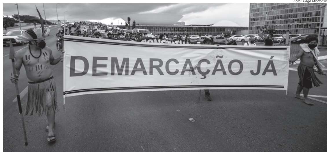
Povos indígenas marcharam até o STF, onde pediram ao presidente da Corte, Luiz Fux, que coloque o caso de repercussão geral novamente em pauta

Consta ainda que o Mato Grosso do Sul registra o maior número de indígenas vítimas fatais de acidentes de trânsito, pelo menos sete casos, dos 26 registrados em todo país. Com a expulsão dos territórios tradicionais, resta às margens de rodovias ou às áreas degradadas as famílias indígenas sem terras, aumentando os índices de vítimas fatais por acidente de trânsito. Os dados podem ser acessados no capítulo sobre “Homicídio culposo”, do relatório de Violência Contra os Povos Indígenas do Brasil – dados de 2020.