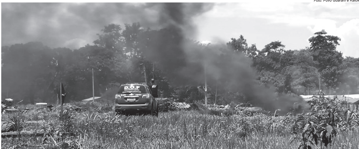
Cenário de guerra: novamente, conflito deixa feridos nas retomadas próximas à Reserva Indígena de Dourados, no Mato Grosso do Sul

→ Já os óbitos na pandemia contabilizados pela Sesai em 2020, um total de 507, foram registrados em todos os DSEIs – Distrito Sanitário Especial Indígena. A maior incidência ocorreu nos DSEIs Mato Grosso do Sul (72), seguidos do Leste de Roraima (47) e Xavante (46). A Articulação dos Povos Indígenas no Brasil (Apib), em 2020, registrou óbitos de indígenas causados pela Covid-19 em 24 estados, sendo os mais atingidos Amazonas (212 mortes), Mato Grosso (143), Mato Grosso do Sul (94) e Roraima (93).