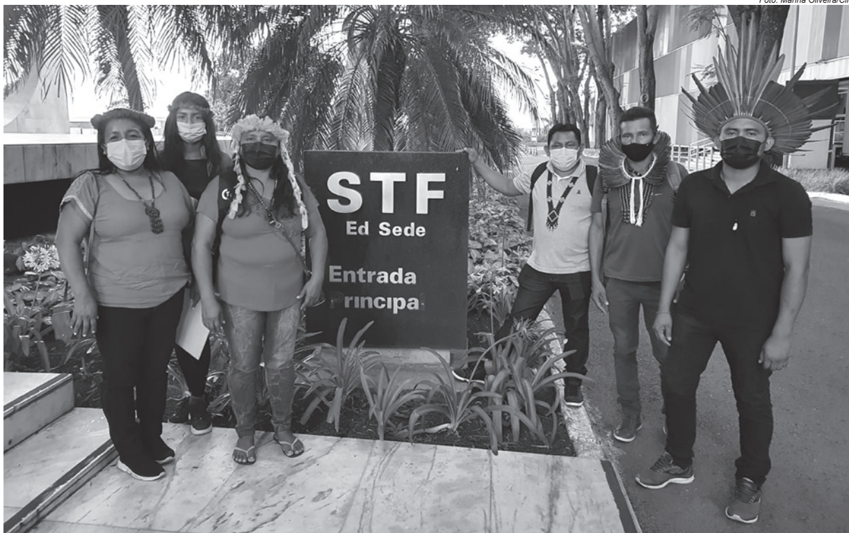
Lideranças dos povos Macuxi e Wapichana foram ao Supremo Tribunal Federal (STF), em outubro, para reunião com o secretário-geral da presidência da Corte

“Acompanhamos, atentamente, o julgamento do Recurso Extraordinário com repercussão geral sobre nossos direitos territoriais, consideramos o ‘julgamento do século’. Também sabemos que esse processo vai afetar todos os povos indígenas do Brasil, especialmente nossos parentes que não dispõem de terras demarcadas e, caso seja aplicado entendimento contrário aos direitos constitucionais, podem perder o direito de demarcação de suas terras”, afirmaram os povos no pedido. ♦