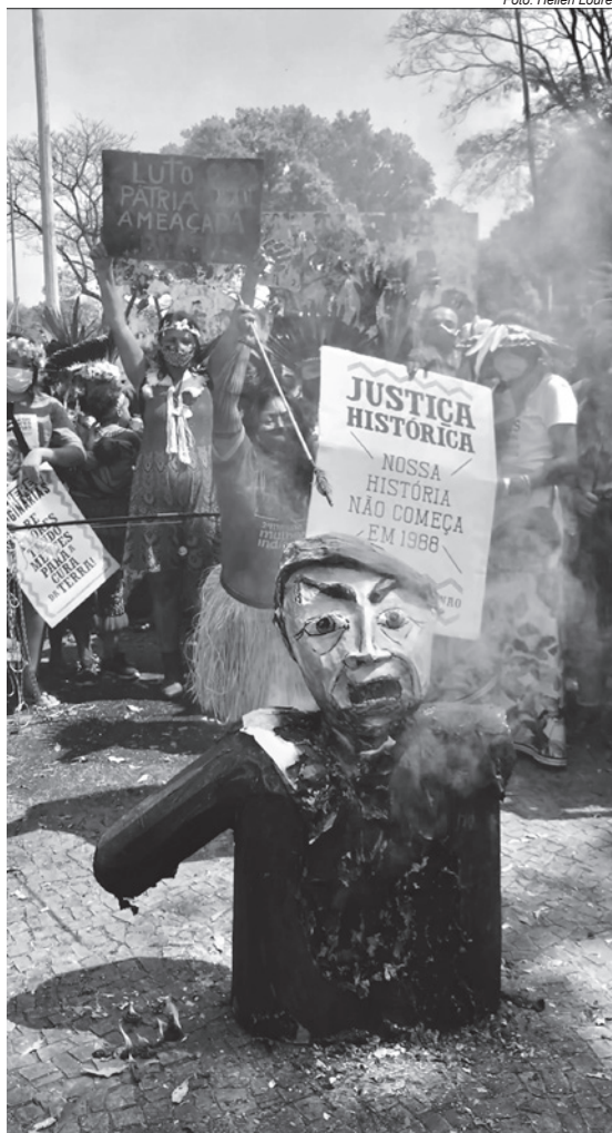
Marcha das mulheres setembro 2021

No dia 11 de outubro, o ministro Alexandre de Moraes devolveu os autos para a retomada do julgamento, que agora passa a depender novamente