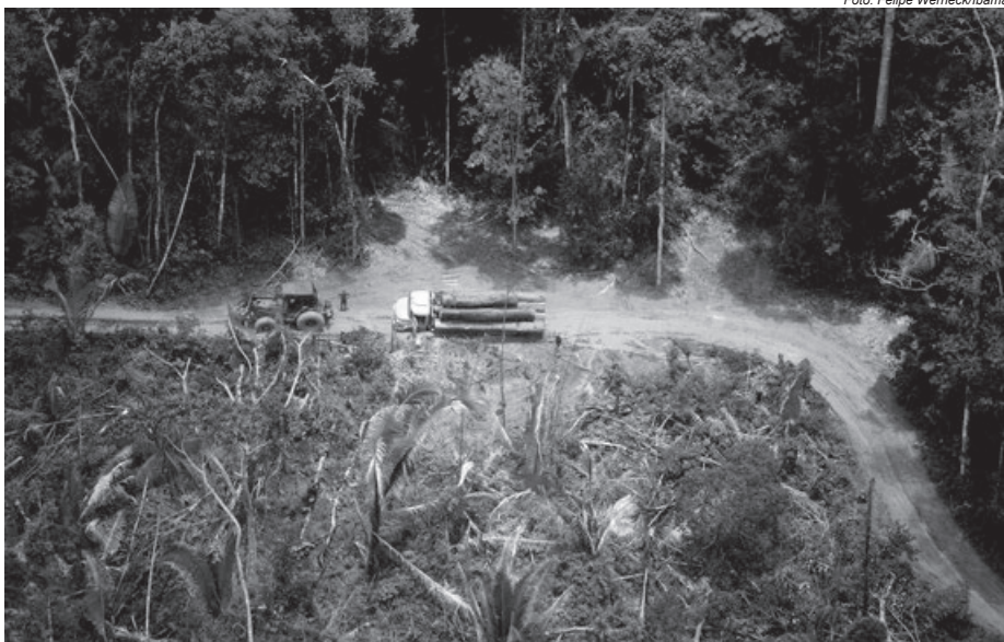
Madeira ilegal apreendida na Terra Indígena Pirititi (RR)