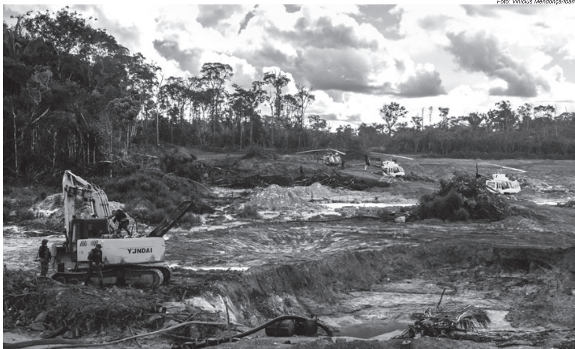
Operação de combate ao garimpo ilegal na Terra Indígena Tenharim do Igarapé Preto (AM)

Afinados com a realidade, esses dados explicitam uma tragédia sem precedentes no país: as terras indígenas