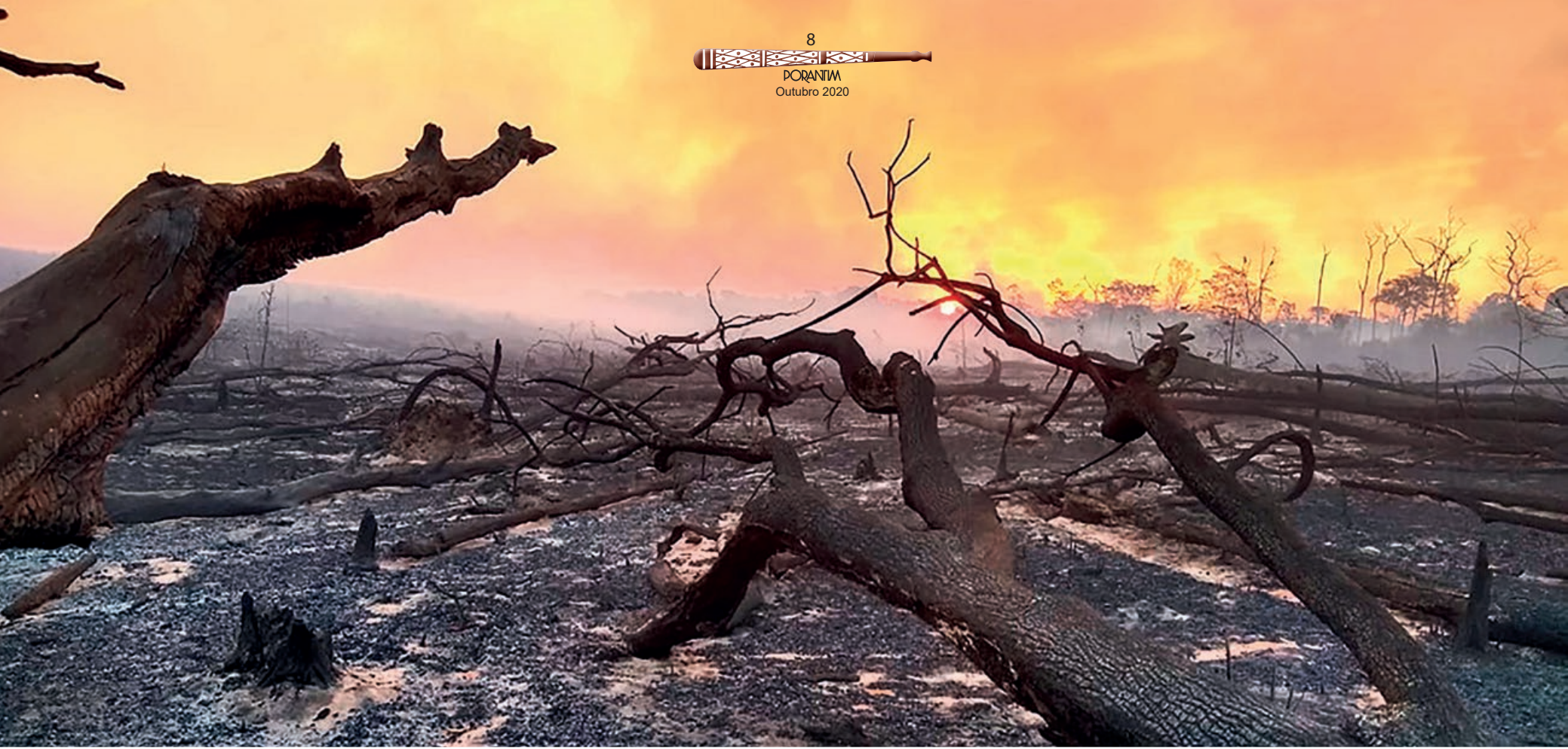
Parque Indígena do Xingu também sofreu com incêndios: território está cercado por fazendas de monocultivos