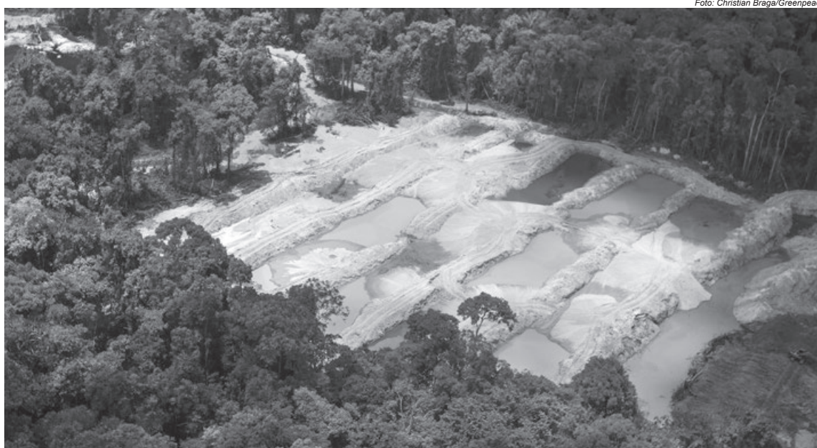
Terra Indígena Munduruku invadida por garimpos: denúncias chegaram à ONU, mas governo brasileiro responde querendo legalizar garimpos

E para dar forma de legalidade a todas as medidas contrárias aos povos indígenas, o governo se amparou no Parecer 001, da Advocacia Geral da União (AGU), que vigora desde 2017. Neste parecer, se adotou uma lógica de desqualificação dos direitos constitucionais indígenas, aplicando de forma enviesada as 19 condicionantes do julgamento da ação popular contra a demarcação da TI