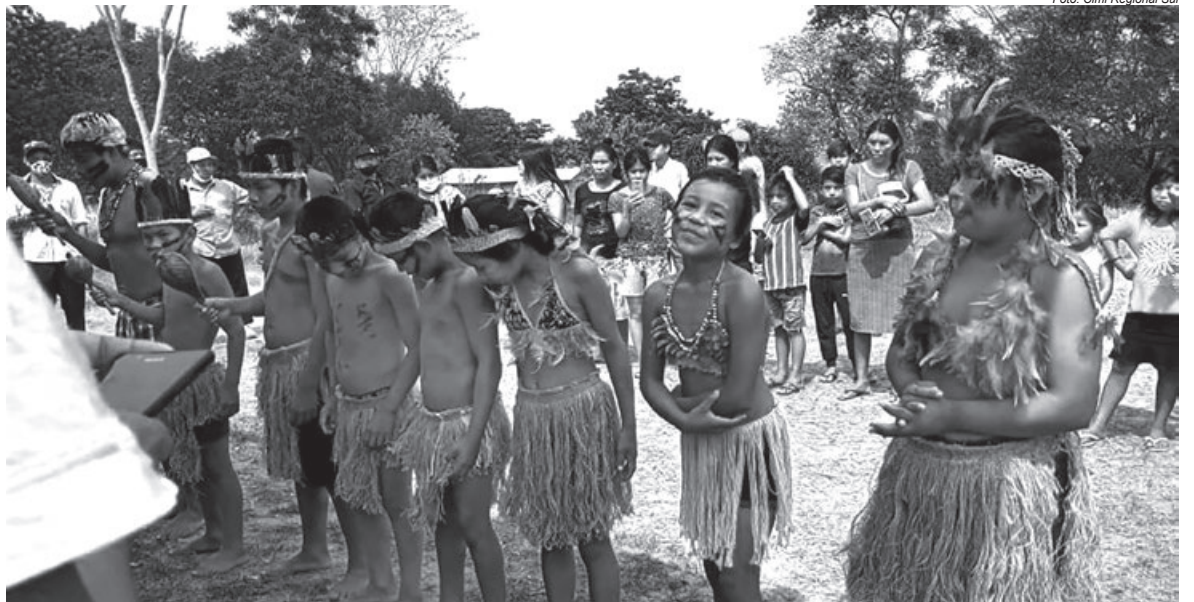
Mobilização organizada pelas mulheres indígenas reuniu as 14 aldeias do tekoha Guasu Guavirá

A interrupção na entrega das cestas básicas pode agravar ainda mais a situação de vulnerabilidade dos povos, junto com o isolamento social compelido pela pandemia da covid-19; a fome tornou-se uma triste realidade para os povos no oeste do Paraná. “É muito difícil sem saneamento básico, com esse pouco de água e agora sem as cestas básicas. O que acontece é que precisamos de água e alimentação”, defende o cacique da TI Guasu Guavirá.