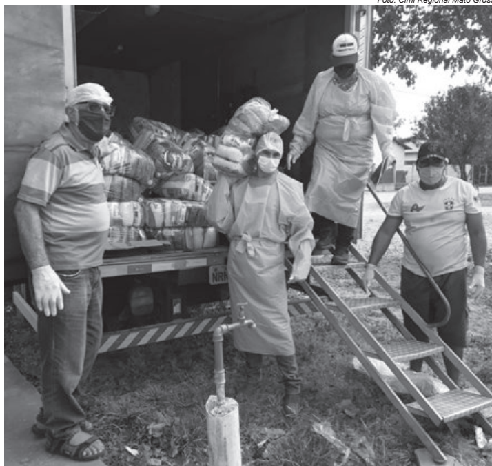
Entrega de cestas básicas ao povo Bororo na Terra Indígena Tereza Cristina

O regional também atuou no fortalecimento das barreiras sanitárias e com medidas de conscientização e informação sobre o novo coronavírus