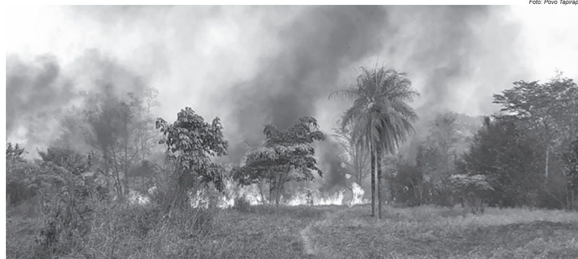
Terra Indígena Urubu Branco, do povo Tapirapé, no Tocantins, teve dezenas de hectares devorados pelo fogo

Uma análise mais minuciosa das fichas descritivas de cada um destes 256 casos revela que na maioria das situações de invasão/exploração/dano houve o registro de mais de um tipo de dano/conflito, totalizando 544 ocorrências. Desse modo, é possível verificar um