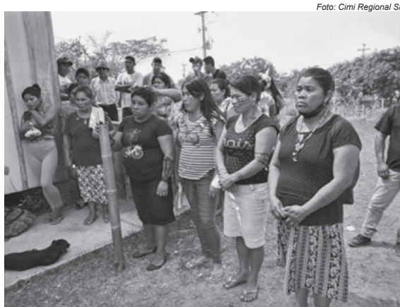
As lideranças reivindicam o restabelecimento na entrega das cestas básicas, saneamento, melhorias no atendimento à saúde e seus territórios demarcados

No Paraná, segundo relatório de Violência Contra os Povos Indígenas , organizado pelo Cimi, edição com dados de 2019, há 40 terras indígenas com alguma pendência administrativa: 20 terras indígenas sem providências, entre elas o tekoha Yv'a Renda, dos Ava Guarani; 14 a identificar; 5 identificadas; e apenas uma declarada.