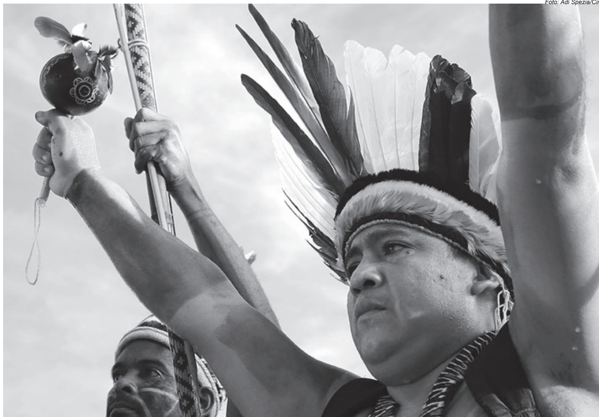
Índigena durante protesto em Brasília: 2019 marca o aumento significativo das violências e invasões às terras indígenas e ataque aos direitos constitucionais

Quando olhamos o conjunto de todos os dados, observamos que há neles uma ação de governo premeditada e planejada para o extermínio, que se implementa pelo incentivo à invasão e ao desrespeito aos direitos constitucionais indígenas. Não vemos apenas percentuais de áreas desmatadas, mas vidas existentes sob o risco de destruição, vemos as centenárias árvores sendo abatidas e, com elas, inúmeros seres.