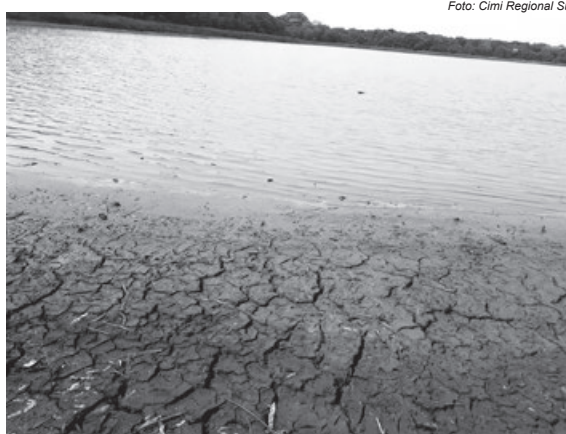
O baixo nível do reservatório da Itaipu Binacional reflete a gravidade da estiagem prolongada e a falta de água denunciada pelos indígenas

Com largo histórico de violências e violações, indígenas das 14 aldeias do tekoha Guasu Guavirá se reuniram em mobilização no último dia 3 de outubro para reivindicar seus direitos originários, em especial o direito à demarcação de seus territórios tradicionalmente ocupados. A mobilização foi organizada pelas mulheres indígenas e as reivindicações foram enviadas ao MPF.