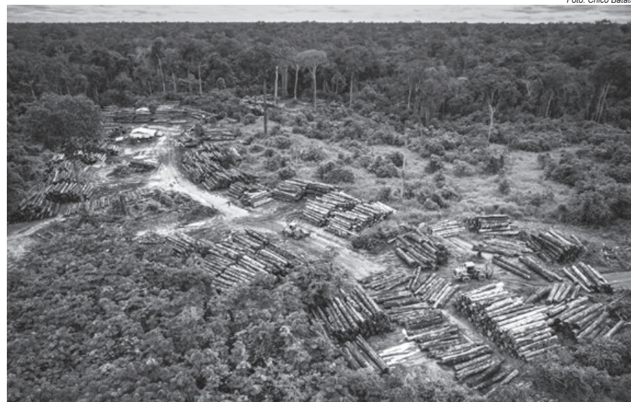
Terra Indígena Karipuna sofre com a ação de madeireiros e caçadores, além da grilagem de terras

desdobramento dos 256 casos consolidados de acordo com as seguintes motivações: