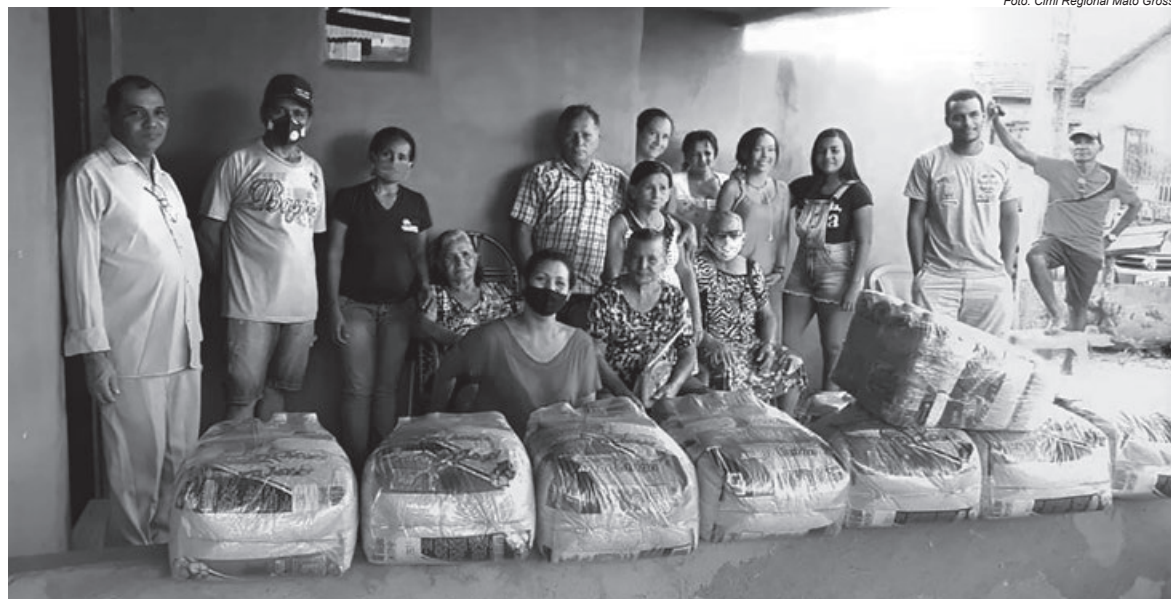
Em Confresa, as cestas de alimentos mobilizadas pelo Cimi Regional Mato Grosso chegam ao povo Xerente