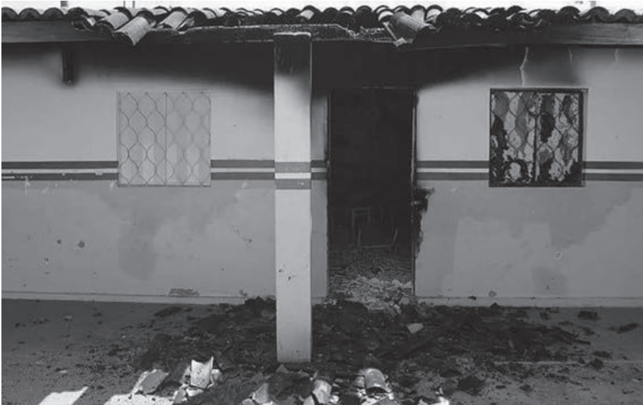
Registro da degradação da escola cedida pelo governo municipal ao povo indígena Pankararu

A situação geral dos povos indígenas no Brasil foi repudiada pelo Conselho Continental da Nação Guarani – composto por lideranças do Brasil, Argentina, Paraguai e Bolívia