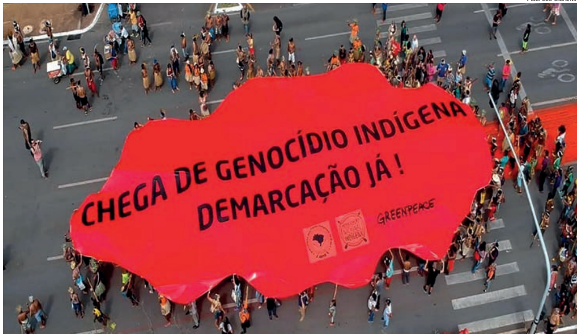
Protesto realizado pelos povos indígenas presentes no Acampamento Terra Livre (ATL) 2018

A partir do relatório de Goergen, o conteúdo do Parecer 001/2017 da Advocacia-Geral da União (AGU) – conhecido como Parecer Antidemarcação e apontado como inconstitucional pelo Ministério Público Federal (MPF) – também é incorporado ao projeto e pode ser fixado em lei.