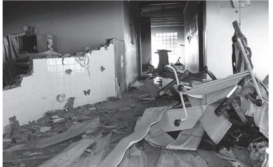
Registro do que sobrou do Posto de Saúde da Família de atendimento aos indígenas Pankararu