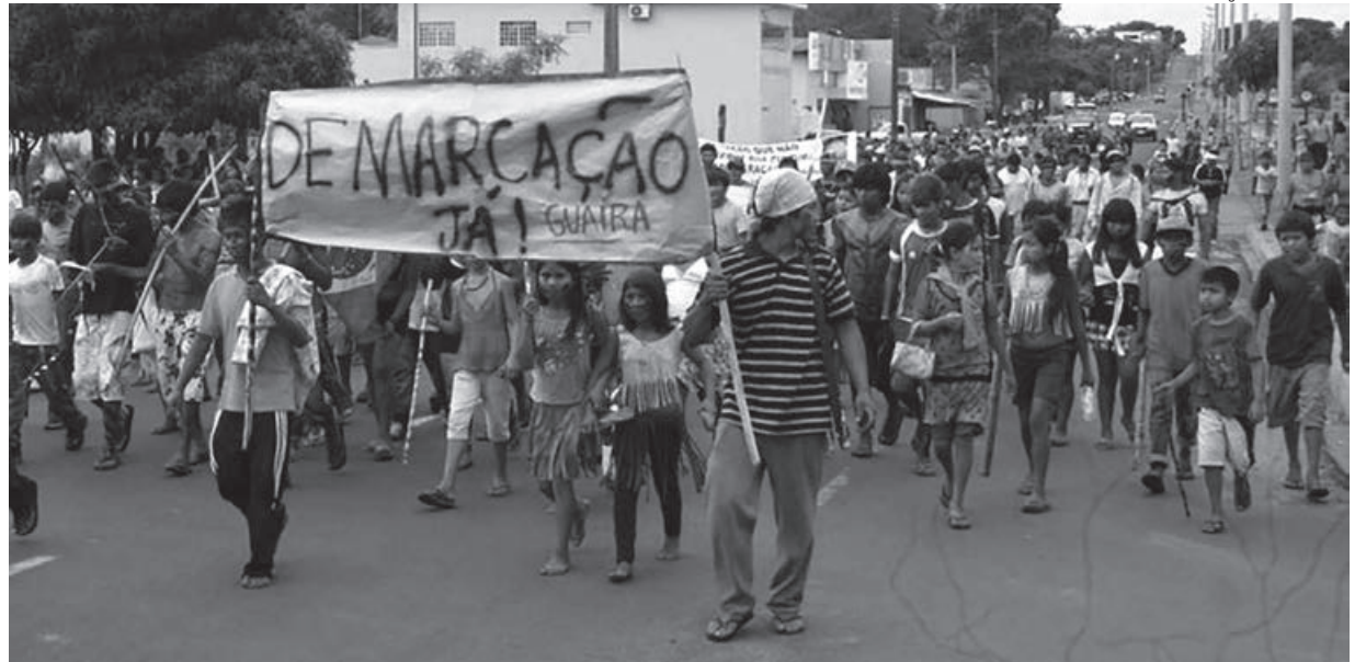
Protesto Guarani na cidade de Guaíra, Paraná, ocorrida em 2013

Em dezembro de 2017, foi assinado um manifesto de apoio às comunidades Guarani do oeste paranaense contra o discurso de ódio praticado contra a presença das comunidades Guarani em suas áreas de ocupação tradicional, cujos estudos estão sendo realizados pela Fundação Nacional do Índio. Na