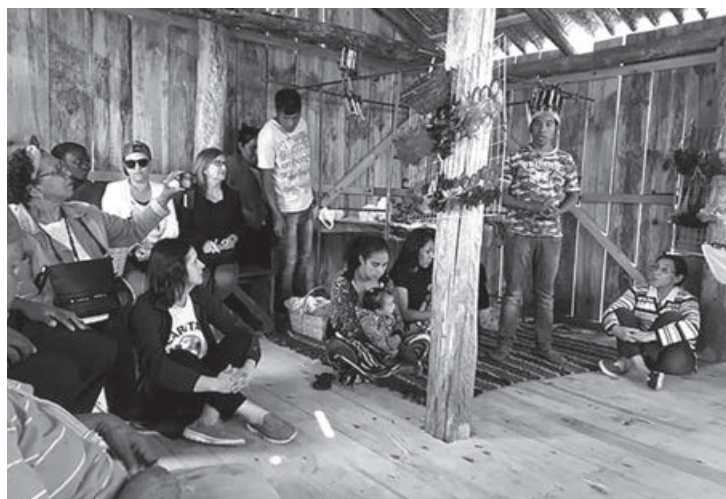
As reflexões que se seguiram na “roda de conversa” encontraram várias semelhanças, algumas diferenças e muitos desafios

O evento contou com a presença de comunidades quilombolas de Rincão da Faxina, Palmas, Brasa Moura e Nicanor da Luz; a comunidade indígena Aldeia Gyró; Migrantes Haitianos e Senegaleses; Pastoral Afro; Pastoral do Migrante; CIMI e agentes Cáritas de Pelotas, Rio Grande e Bagé, além do Secretariado Regional da Cáritas Brasileira, coordenador do Encontro. ♦