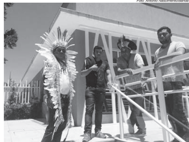
Indígenas na sede da Casa de Saúde do Índio, em Vila Izabel, Curitiba