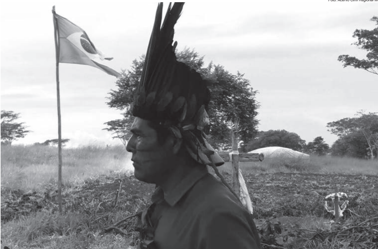
Comunidade Indígena Caarapó: série de violências contra tekoha segue impune e não há perspectivas de mudanças