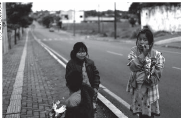
Crianças Guarani também são alvos de racismo nas ruas de Guaíra

As consequências da falta de demarcação repercutiram em todos os aspectos da vida dos Guarani. Os governos municipais e estadual usaram o argumento da não regularização das terras para se eximirem da responsabilidade na prestação de serviços públicos