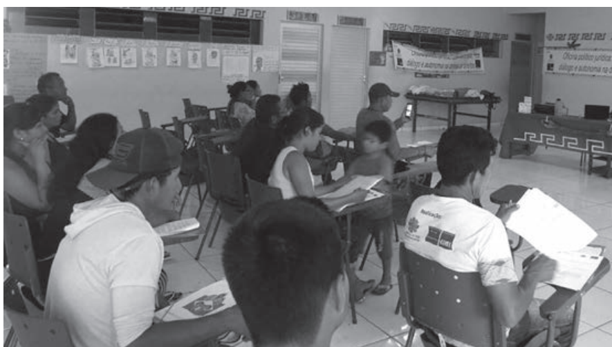
Plenária da 3ª etapa da Oficina Político-jurídica. Aldeia Porto Praia, Tefé