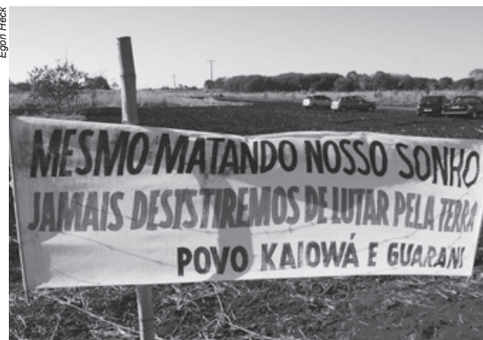
O preconceito contra os indígenas, considerados “incapazes” e “selvagens”, fundamenta-se, especialmente, no interesse pelas suas terras e pelos bens naturais nela existentes

Tekoha Guasu Guarani e Kaiowá Líderes da Aty Guasu, Assembleia do grande povo Guarani e Kaiowá