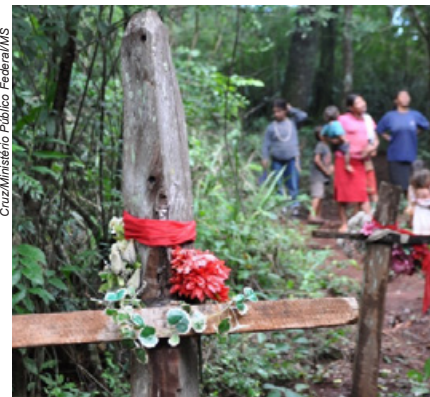
Cruz/Ministério Público Federal/MS

A investigação dos assassinatos e das violências cometidas contra os povos indígenas no Mato Grosso do Sul é o objetivo principal da CPI do Genocídio, assim como a punição dos responsáveis