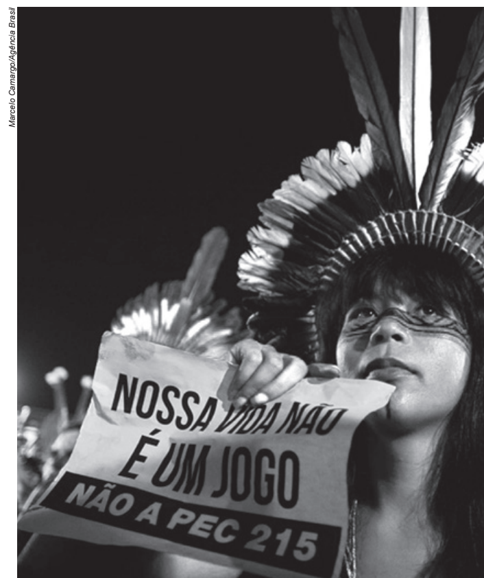
A bancada ruralista aprovou a PEC 215 durante a realização do I Jogos Mundiais dos Povos Indígenas, o que causou protestos em todo o país