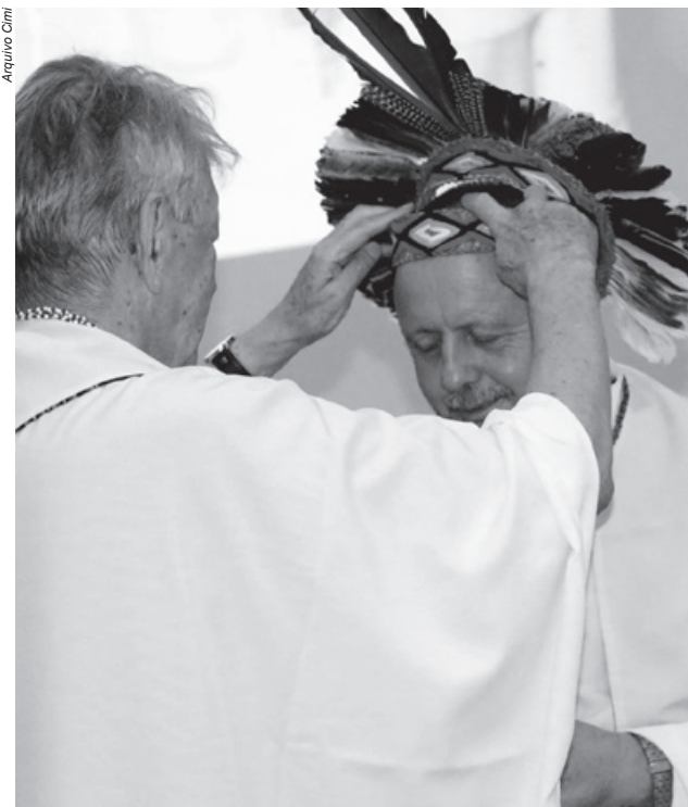
Dom Erwin, que esteve à frente da presidência do Cimi por 17 anos, “passou o cocar” para Dom Roque, atual arcebispo de Porto Velho

O documento final da Assembleia corrobora a avaliação da subprocuradora, afirmando que as instituições do Estado buscam derrotar projetos coletivos de futuro e que a propriedade privada converteu-se em direito absoluto, acima de qualquer outro: “Violências de todas as ordens se sucedem numa escala sem precedentes na história contemporânea do país. Desde a primeira Assembleia do Cimi, em 1975, defendemos a Mãe Terra como condição necessária para a autodeterminação dos povos