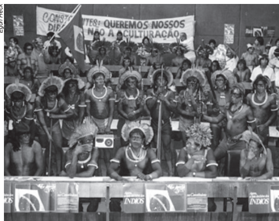
Cinco anos após a promulgação da Constituição, setores vinculados às elites tentaram implementar uma revisão do texto que retirava os direitos indígenas

O capitalismo selvagem não suporta a existência da propriedade coletiva e nem que a terra, como objeto de produção, possa estar fora do seu mercado. Essa ainda é a grande motivação da luta anti-indígena, até hoje.