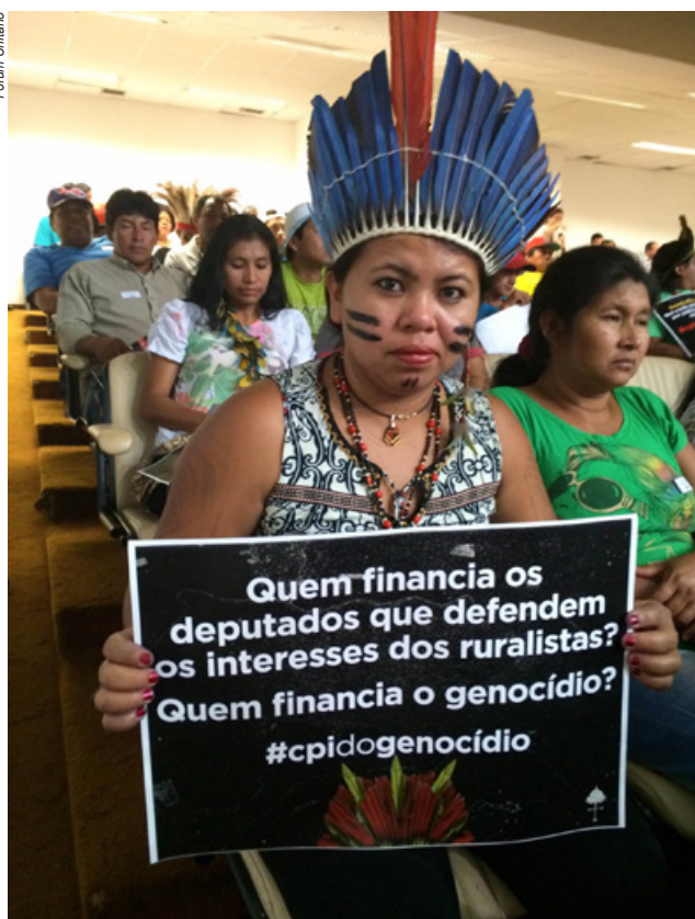
Parlamentares ruralistas do Mato Grosso do Sul financiados por empresas envolvidas na Operação Lava Jato tentam criminalizar o Cimi por seu apoio aos povos indígenas