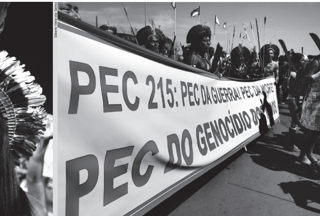
Povos indígenas têm se mobilizado, incessantemente, em todo o país contra a PEC 215 porque sabem que ela significa a vitória do antigo projeto de extermínio de suas populações